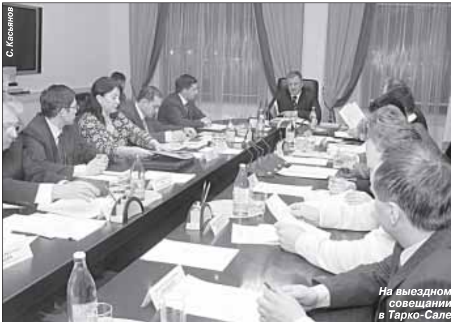
На выездном совещании в Тарко-Сале

Животноводство: на 1 января 2007 года в сельхозпредприятиях численность крупного рогатого скота составила 1,1 тыс. голов, в том числе коров - 0,5 тыс. голов; свиней - 1,6 тыс. голов.