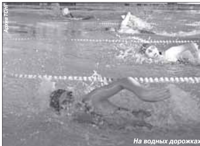
На водных дорожках

«Уже несколько лет самым долгожданным событием для нас является поездка в г. Тарко-Сале на День компании. Мы серьезно готовимся к спортивным мероприятиям, посвященным этому дню. И об этом говорит