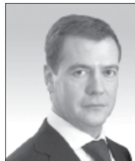
МЕДВЕДЕВ ДМИТРИЙ АНАТОЛЬЕВИЧ

Доходы: не указана стоимость подарков, Международный благотворительный фонд «Меценаты столетия», 17 084 руб. (сведения представлены ФНС России).