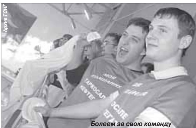
Болеем за свою команду

Отдел информации и связей с общественностью ООО «НОВАТЭК-ТАРКОСАЛЕНЕФТЕГАЗ»