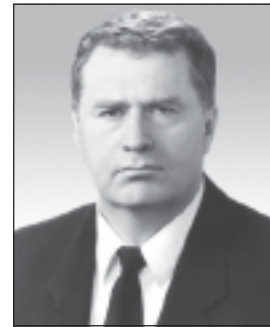
ЖИРИНОВСКИЙ ВЛАДИМИР ВОЛЬФОВИЧ

Недвижимое имущество: не указана квартира, 64,3 кв. м, г. Москва, общая совместная собственность (сведения представлены УФРС по Москве, ФНС России).