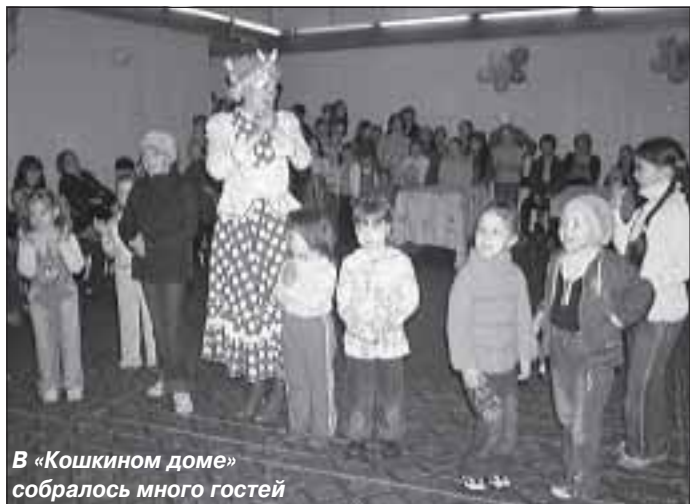
В «Кошкином доме» собралось много гостей

Пасмурная погода, выдавшаяся в первое летнее утро, не испортила праздничное настроение. Основные мероприятия, приуроченные к Дню защиты детей, все же состоялись: проведение некоторых было перенесено «под крышу», а вот велосипедным гонкам, на которые собралось немало участников, даже моросящий дождик не помешал. Но обо всем по порядку.