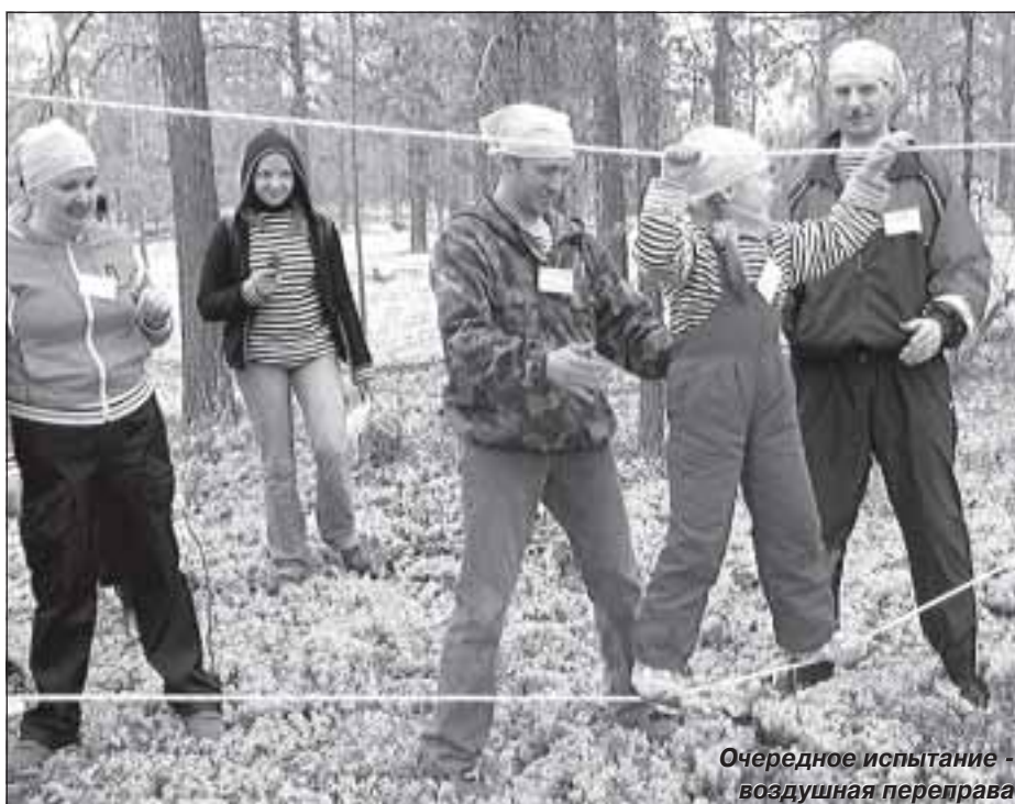
Очередное испытание - воздушная переправа

в прошлой жизни была пиратом. Ведь не зря и клад-то она увидела первая.