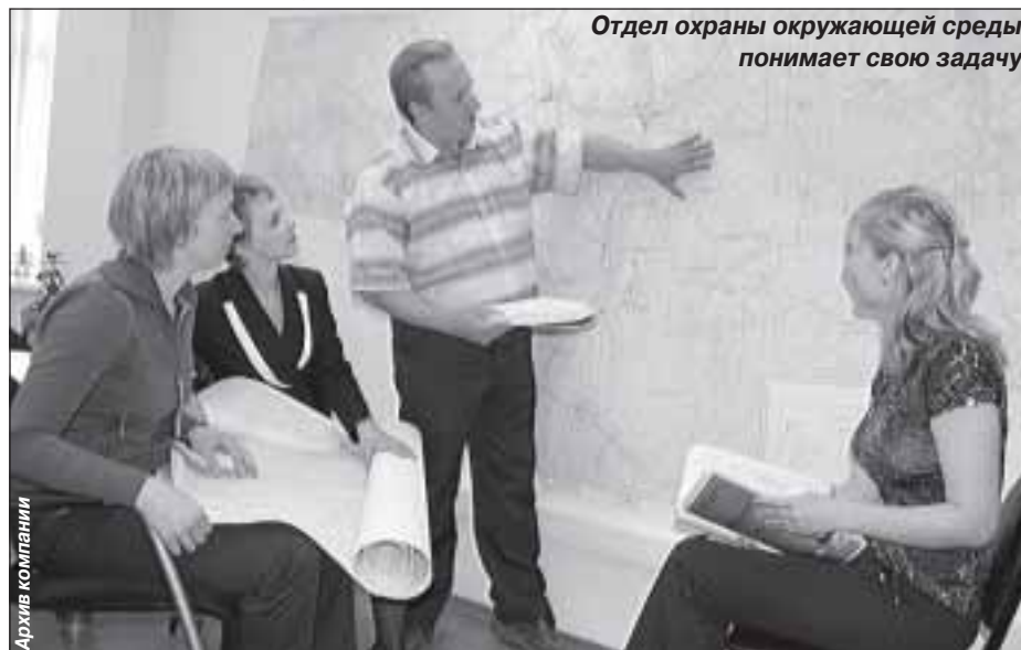
Отдел охраны окружающей среды понимает свою задачу

Когда при поездке в отпуск начинаешь рассказывать друзьям, что в Тарко-Сале, чтобы набрать грибов, достаточно проехать три километра от города за станцию «Орбита», чтобы наловить ведро рыбы достаточно выйти на набережную города, что клюкву можно собирать в одном километре, у всех это вызывает только недоверие. Да, подавляющее большинство людей природу видит в лучшем случае на