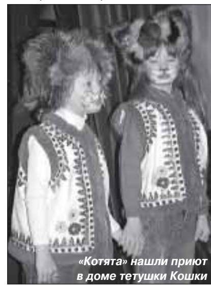
«Котятка» нашли приют в доме тетушки Кошки