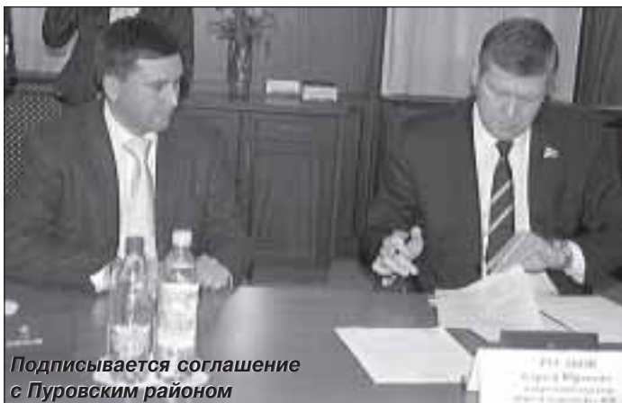
Подписывается соглашение с Пуровским районом