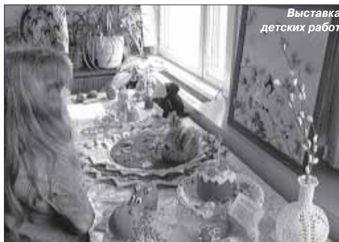
Выставка детских работ