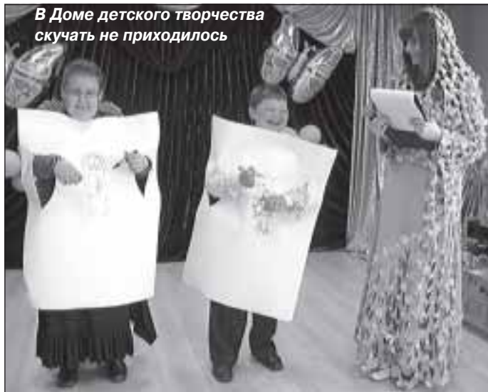
В Доме детского творчества скучать не приходилось