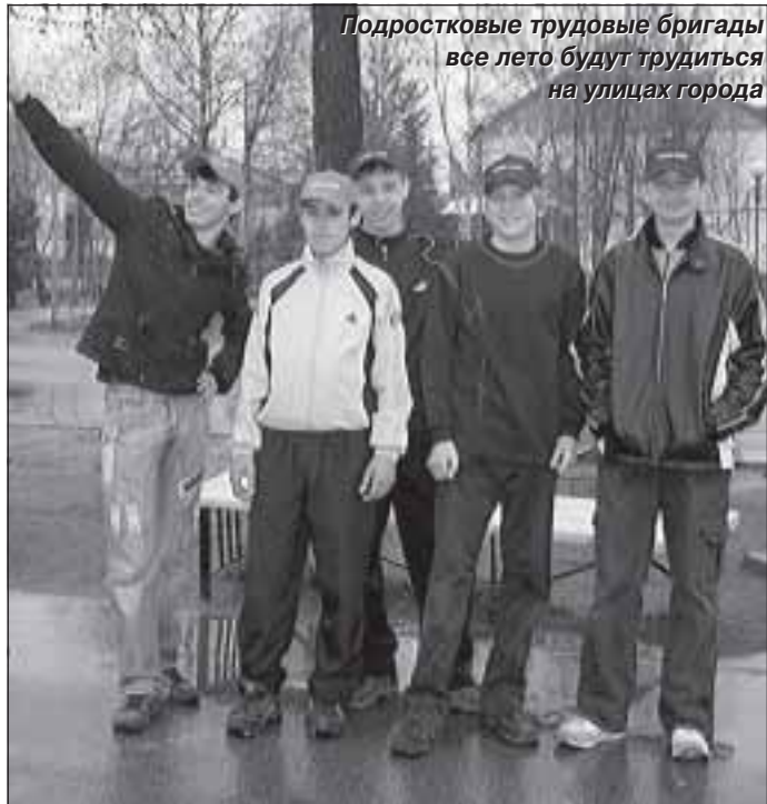
Подростковые трудовые бригады все лето будут трудиться на улицах города