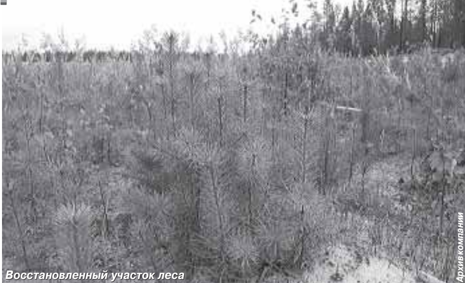
Восстановленный участок леса

Если раньше проблемы охраны окружающей среды были в ведении узких специалистов, то на сегодня эти вопросы и у нас в стране все