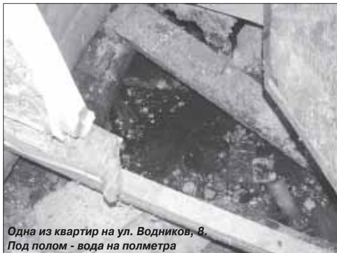
Одна из квартир на ул. Водников, 8. Под полом – вода на полметра

Цифровая конкретика, прозвучавшая из уст главного экономиста района, подробный расклад деятельности предприятий ЖКХ и озвучивание их внутренних проблем побудили глав поселений к активному обсуждению темы. По-разному складывается ситуация в каждом населенном пункте, на пути реализации реформы у каждого поселения свои камни преткновения, но есть общие для всех проблемы.