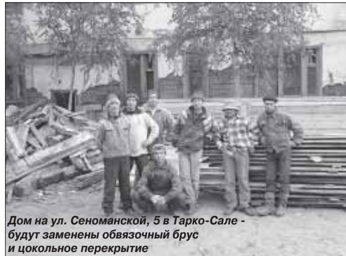
Дом на ул. Сенюманской, 5 в Тарко-Сале - будут заменены обвязочный брус и цокольное перекрытие

На сложности, возникающие во взаимоотношениях местной власти и населения по поводу проводимых реформ, обратила внимание Ж. А. Белоцкая. Вроде бы реформирование направлено на укрепление этой взаимосвязи. Но на деле получается, нельзя объяснить многое из-за несовершенства законодательной базы. Пример: оплата за