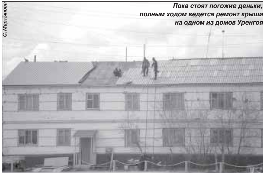
Пока стоят погожие деньки, полным ходом ведется ремонт крыши на одном из домов Уренгоя