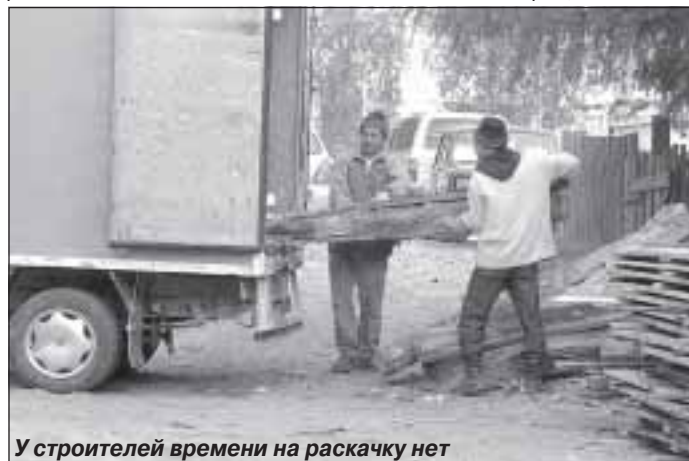
У строителей времени на раскочку нет

А с управляющей компанией вопрос завис в воздухе. Прошел конкурс. Определен исполнитель. Но договор с ним, скорее всего, заключен не будет. И конкурс будет признан недействительным. Потому что на таком рынке жилья не может, не неся убытков, работать ни одна компания. «Предприятие пошло на обслуживание жилфонда, доверив нам свою судьбу. И изначально мы его загоняем в долги. Для примера – в многоэтажной высотной Тюмени для инвесторов, выходящих