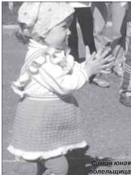
Самая юная болельщица

В соответствии с занятыми местами команды были награждены почетными грамотами и памятные призы от ОГИБДД ОВД по МО Пуровский район. Все участники соревнований получили «Свидетельство велосипедиста» и памятные призы от администрации города Тарко-Сале.