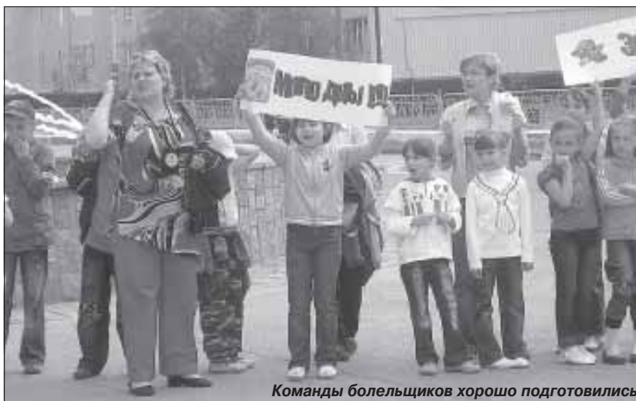
Команды болельщиков хорошо подготовились

В целях активизации агитационно-пропагандистского сопровождения реализации Федеральной целевой программы «Повышение безопасности дорожного движения в 2006-2012 годах», привлечения внимания широкой общественности к проблемам