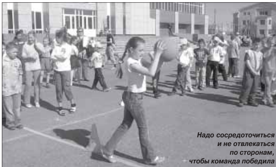
Надо сосредоточиться и не отвлекаться по сторонам, чтобы команда победила

На территории Пуровского района остается сложной ситуация с аварийностью на дорогах. Так, за шесть месяцев 2008 года произошло 42 дорожно-транспортных происшествия, в которых погибли 10 и ранены 52 человека. Обострилась ситуация и с детским дорожно-транспортным травматизмом. Несмотря на проведение всевозможных акций и мероприятий, лекций и бесед с юными участниками дорожного движения, в нашем районе пострадали 4 ребенка, в том числе 3 по вине самих детей.