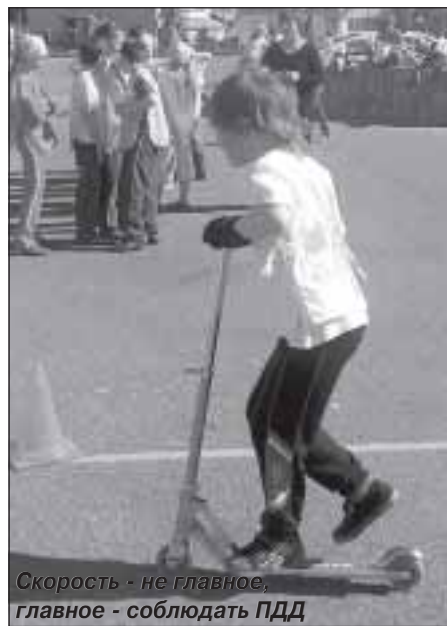
Скорость - не главное, главное - соблюдать ПДД

Особенность данного мероприятия - это игра, которая помогает ребёнку правильно вести себя не только на дорогах, но и в сложных жизненных ситуациях. Немаловажными являются и возможность самовыражения, формирования гармоничной личности, а также приобщение к здоровому образу жизни. В подобных соревнованиях ребята проявляют смекалку, эрудицию, смелость и ловкость, учатся помогать друг другу.