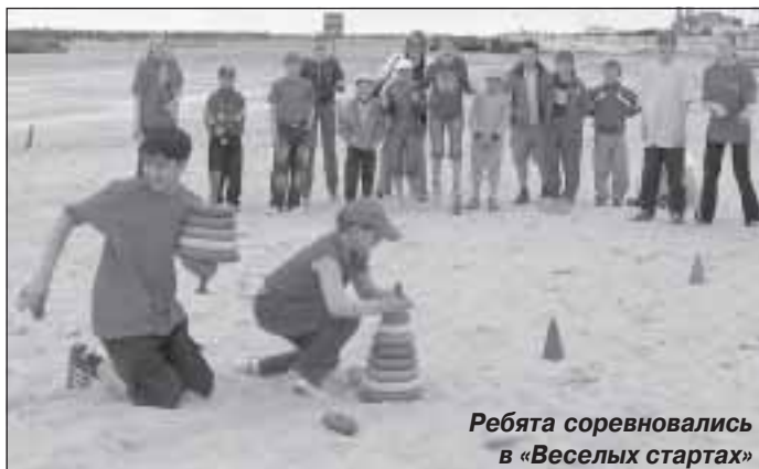
Ребята соревновались в «Веселых стартах»

Празднование Дня молодежи по обыкновению собрало на городском пляже таркосалинцев всех возрастов. То ли теплое солнышко, благоволившее нам в этот день, то ли аппетитный запах шашлыков, то ли обещанная развлекательная программа, а скорее всего все это вместе взятое завлекало горожан на берег Пура, где была развернута концертно-игровая площадка.