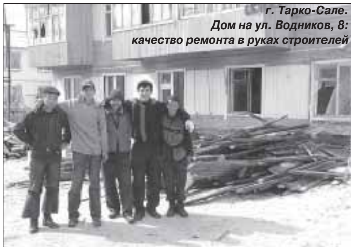
г. Тарко-Сале. Дом на ул. Водников, 8: качество ремонта в руках строителей