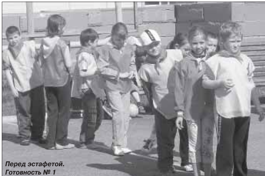
Перед эстафетой. Готовность № 1

обеспечения безопасности дорожного движения и профилактики детского дорожно-транспортного травматизма отделом ГИБДД Пуровского района разработаны и проведены в июне текущего года профилактические мероприятия с детьми.