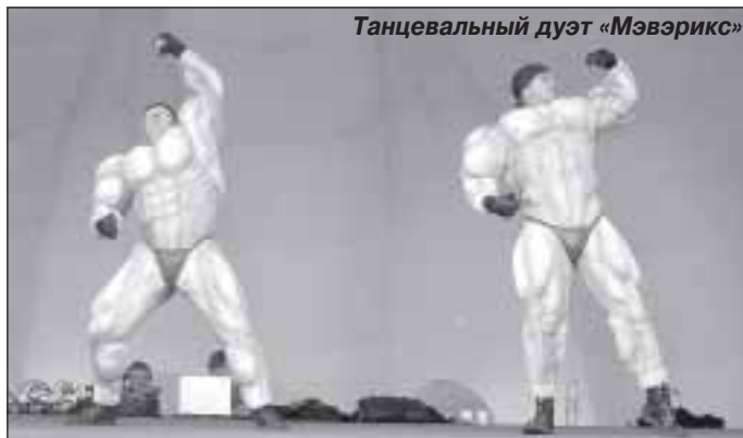
Танцевальный дуэт «Мэвэрикс»

тной сценой их ждали аттракцион по метанию колец и трасса «Веселые старты», на которой ребята соревновались в меткости, ловкости, силе и скорости. В этих же качествах могли похозяйничать и представители старшего поколения. Для них была подготовлена площадка для игры в пляжный волейбол, необходимый инвентарь по гиревому спорту, перетягиванию каната, армреслингу. Два последних вида сопровождал, пожалуй, особый накал спортивных страстей. Яростная борьба соперников за победу не могла оставить равнодушными даже далеких от спорта зрителей. Особенно запомнилась схватка команд в перетягивании каната: зарывшись уже чуть ли не по колена в песок, участники ни той, ни другой стороны не желали отдавать победу. Казалось, канат разорвется пополам – так ожесточенно, до последних сил бились противники. Это спортивное зрелище ничуть не уступало по эффектности концертным номерам, представленным заезжими артистами. Мы и сами себя умеем неплохо развлекать, лиш-