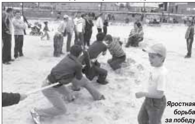
Яростная борьба за победу

Светлана БЕЛЯЕВА