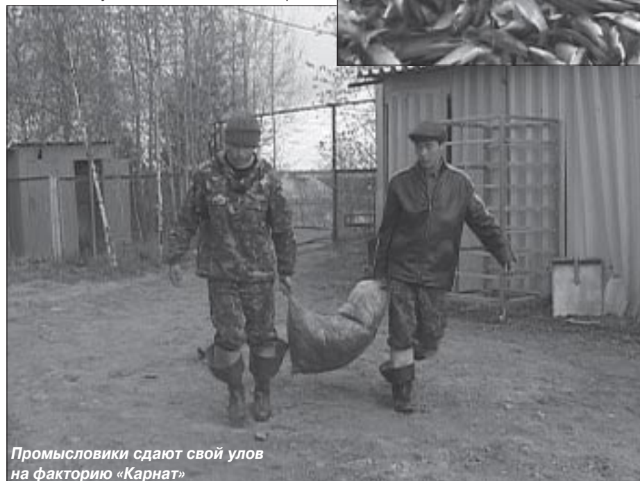
Промысловики сдают свой улов на факторию «Карнат»

заинтересованы в том, чтобы работать добросовестно - их зарплата зависит от объема сдаваемой продукции».