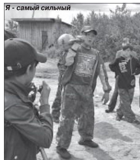
Я - самый сильный