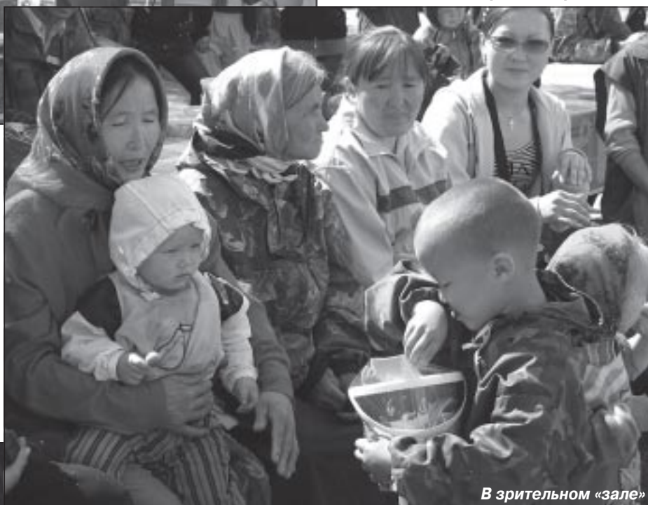
В зрительном «зале»

27 июня 2008 года свой профессиональный праздник отметили рыбаки фактории Быстринка. В качестве подарка сотрудники ЦНК подготовили для них два театрализованных представления. В первой постановке «Гости из Америки» главными персонажами были индейцы. В основу второй инсценировки «На песчаном мысу» легли истории из жизни коренных жителей Севера, здесь