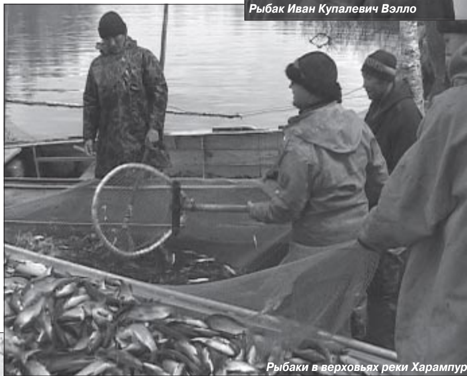
Рыбаки в верховьях реки Харампур