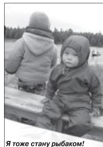
Я тоже стану рыбаком!

После объявления победителей все жители и гости деревни отведали вкусной наваристой ухи, согрелись ароматным