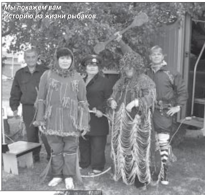
Мы покажем вам историю из жизни рыбаков

чаем. Несмотря на то, что общая трапеза проходила под проливным дождем, настроение у всех было отличным. По мнению жителей Харампура, капли дождя ничто по сравнению с полчищами комаров и мошки, которых в субботний день не было совсем. Видимо, северная природа решила в качестве подарка преподнести рыбакам день без комаров и разогнала ветром назойливый гнус. Люди были рады их отсутствию и не спешили расходиться по домам. Поэтому за столом до самого вечера звучали слова поздравлений, воспоминания старых рыбаков, рассказы молодых общинников о новшествах в рыбодобыче.