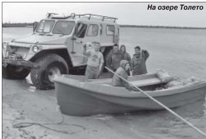
На озере Толето

Вылов рыбы в 220 тонн не предел для Харампуровской общины, наши производственные возможности позволяют вылавливать 260-270 тонн, основания