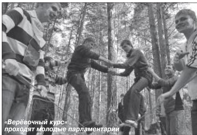
«Верёвочный курс» проходят молодые парламентарии

сразу после заезда, принимающая сторона «подбросила» участникам сюрприз. Делегациям было предложено разделить по своим тематическим площадкам и пройти тренинг на «командообразование» (так его назвали организаторы), а проще говоря, пробежать некую полосу препятствий в лесу. Чем и занимались ребята весь день. Честно признаться, к такому началу были готовы не все и не все были им довольны. Тем более, что в конце дня предстояло сделать еще многое, непосредственно относящееся к форуму.