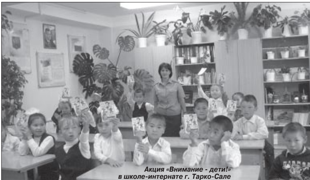
Акция «Внимание - дети!» в школе-интернате г. Тарко-Сале