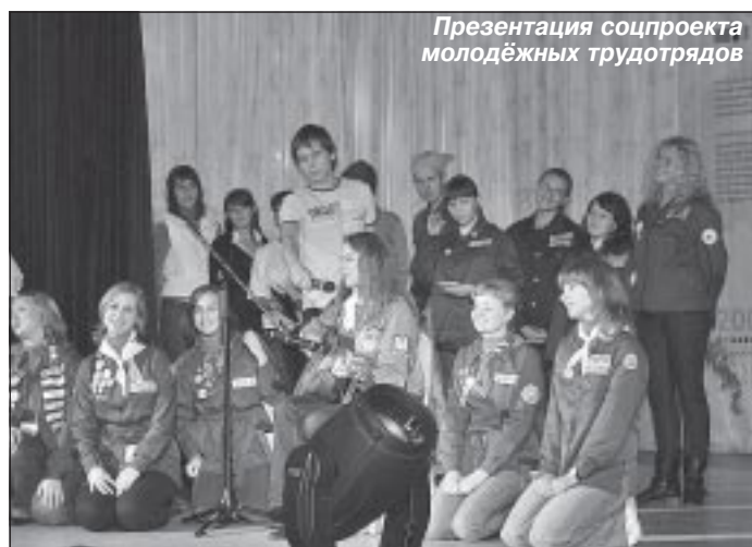
Презентация соцпроекта молодёжных трудовых отрядов