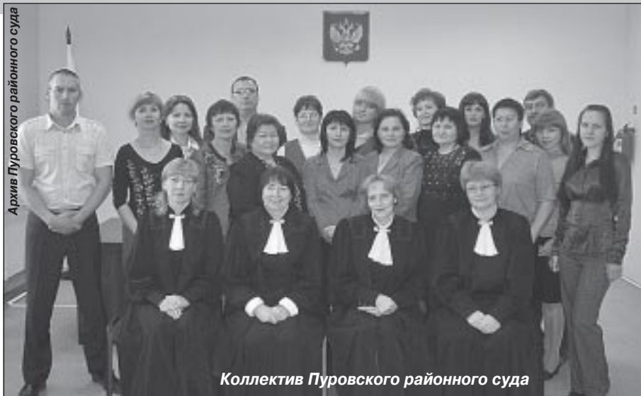
Коллектив Пуровского районного суда

Далее знакомство с судебной властью продолжилось рассказом о Конституционном суде. Интерес вызвала информация о Конституционном (уставном) суде субъекта Российской Федерации, который может быть создан субъектом Российской Федерации. К примеру, Конституционный (Уставный) суд уже действует в Свердловской области. Завершила знакомство с судами информация о Высшем арбитражном суде - высшем судебном органе по разрешению экономических споров.