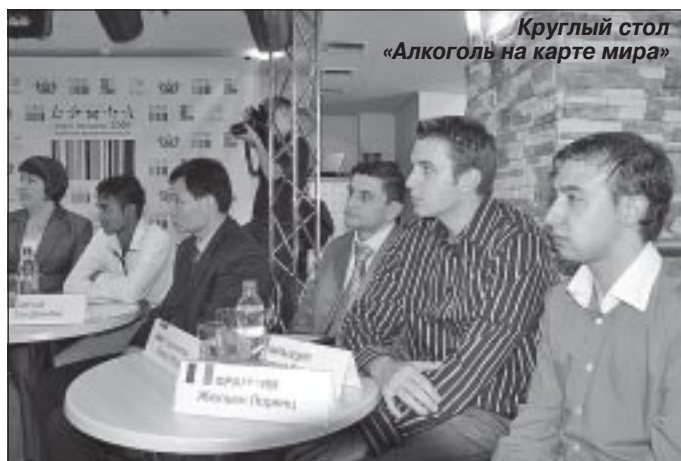
Круглый стол «Алкоголь на карте мира»

ложили участникам организаторы. Ребята встречались, дискутировали на лекциях с виднейшими российскими деятелями молодежной политики, получали новые знания на различных