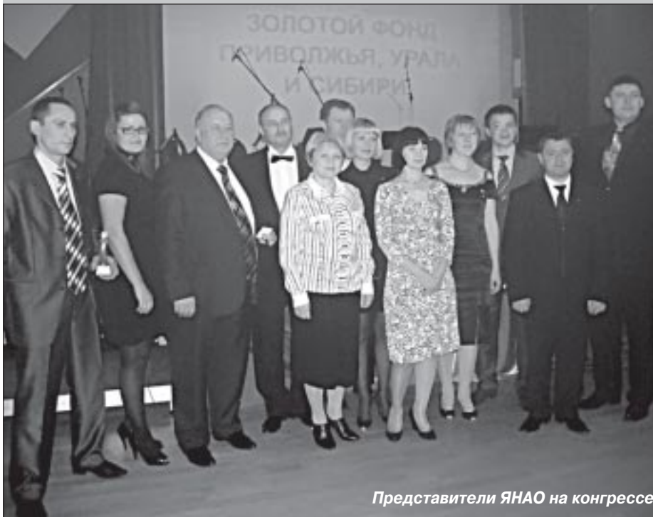
Представители ЯНАО на конгрессе

В прежние, советские времена торговля и общественное питание не баловали потребителя. С прилавков сметалось все, а обслуживание и качество приготовления пищи в столовых не вызвали желания питаться. За небольшой период ситуация в этой отрасли экономики существенно изменилась. Сегодня витрины магазинов ломятся от обилия самых разнообразных товаров, а многочисленные кафе и рестораны предлагают кухню на любой вкус. В этом большая заслуга предпринимателей, не побоявшихся броситься в бушующее море зарождающихся два десятилетия назад рыночных отношений. В настоящее время вклад торговли в экономику составляет почти 20 процентов от ВВП, поэтому очень важно не навредить этой отрасли, особенно в период кризиса, когда в других сферах наблюдается значительный спад.