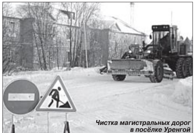
Чистка магистральных дорог в посёлке Уренгой

Если не считать некоторого напряжения, вызванного повышенным чувством ответственности во время морозов, персонал трудился в обычном режиме посменной работы. Всё это относится и к работе других участков МУП ПКС - водоотведения и водоснабжения. В сетях, находящихся на обслуживании предприятия, сбоев в период низких температур не было. И хотя зима ещё не закончилась, а для нашего предприятия она будет продолжаться до конца отопительного сезона, до 14 июня, проверка морозами показала, что подготовка к зиме 2009-2010 была проведена на должном уровне.