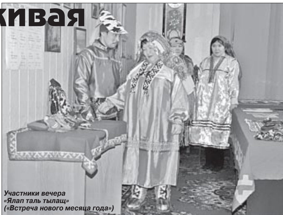
Участники вечера «Ялап таль тылащ» («Встреча нового месяца года»)