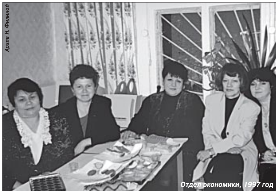
Отдел экономики, 1997 год

В настоящее время в функции отдела входит разработка прогноза социально-экономического развития Пуровского района, формирование основных показателей для разработки доходной части бюджета района. Отдел осуществляет подготовку методических документов для разработки и выполнения районных целевых программ. Если в 90-е годы на территории района работала одна комплексная программа, то на сегодняшний день - 21. В 2008 году Указом Президента РФ были утверждены показатели, оценивающие деятельность органов местного самоуправления. Теперь в полномочия отдела вошел обширный блок работы над сводным формированием данных показателей и работа над докладом главы Пуровского района о достигнутых значениях показателей для оценки эффективности деятельности местного самоуправления. Ну и, конечно, специфику работы отдела не обошел мировой экономический кризис, в настоящее время осуществляется выполнение многочисленных мониторингов по влиянию кризиса на экономику района, в которых отслеживается просроченная задолженность по выплате заработной платы, необос-