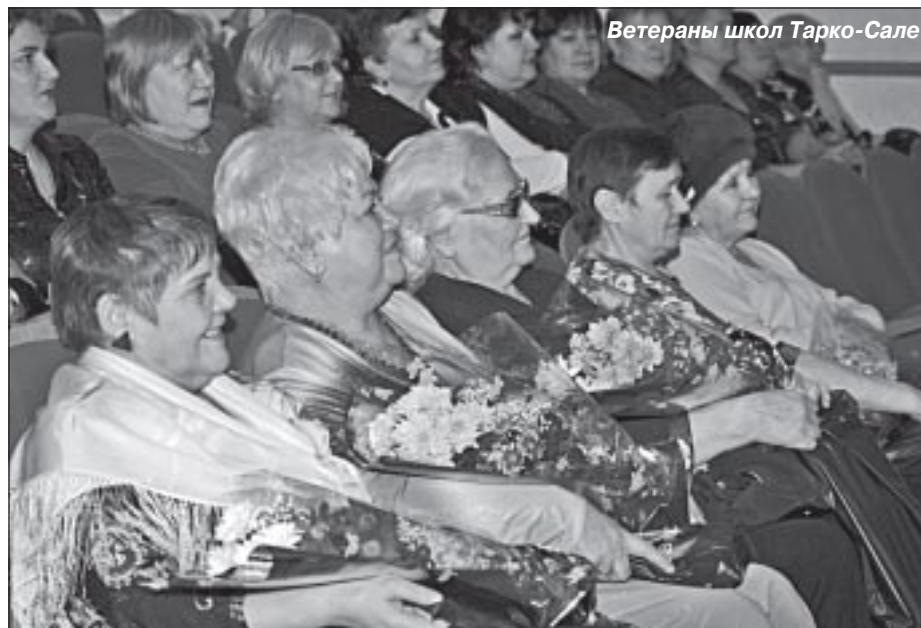
Ветераны школ Тарко-Сале

школ, ветеранов и молодых учителей, рассказывавших о прошлом и настоящем педагогической деятельности. И все это было настолько трогательно, настолько четко передавало ощущения тревоги, заботы и участия в сегодняшней жизни школы, которые испытывают педагоги, что на маленькие заминки никто не обращал внимания. Все было похоже на что-то между педсоветом, где жестко и четко «прошлись» и по достижениям, и по недостаткам современного образования, и одним школьным днем, где каждый урок – выступление отдельного учреждения образования, а перемена – творческие номера учащихся.