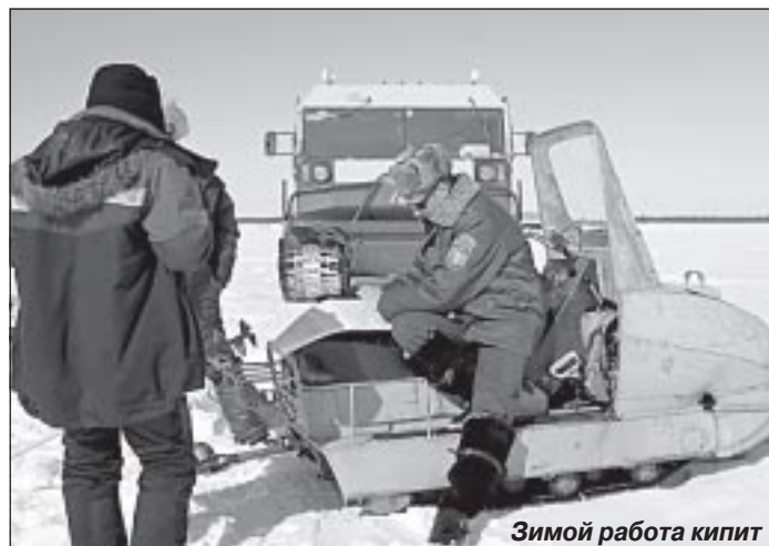
Зимой работа кипит

Иван ЧЕРДАНЦЕВ, студент факультета журналистики Старооскольского филиала Воронежского государственного университета.