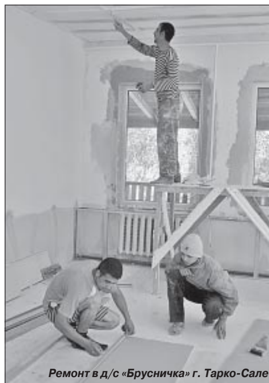
Ремонт в д/с «Брусничка» г. Тарко-Сале

водятся не в течение всего года. Конкурс объявляется за месяц-два до подведения его итогов, чтобы у человека была возможность оценить свои силы и подготовить конкурсные материалы. В рамках конкурсных мероприятий есть пять обязательных документов, которые педагог должен предоставить: заявление, копия трудовой книжки, копия квалификационного листа, таблица результативности и аналитическая справка. Если же говорить о научно-исследовательской деятельности, то запретить этим заниматься педагогу мы не можем. У нас есть педагоги, которые поступили в аспирантуры и пишут научные работы. Я лично категорически против, чтобы они занимались этим