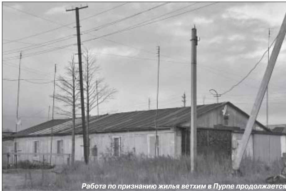
Работа по признанию жилья ветхим в Пурпе продолжается