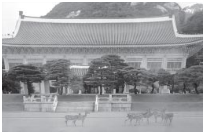
Сеул сегодня: традиционная культура...

А теперь, собственно, о поездке. Когда я начал заниматься тренерской деятельностью, понял, что основы боевого искусства, стойки, прыжковая техника, удары – все это хорошо. Но всего этого мало – требуется серьезная систематизация. В марте этого года у меня и моих товарищей из Ноябрьска и Нижневартовска возникла идея съездить на родину тхэквондо – в Южную Корею, а если конкретнее – в Сеул. В Сеуле есть район, как у нас Пуровск, называется он Кукивон. Там располагается штаб-квартира мирового тхэквондо. Идея возникла не случайно. Так получилось, что в Омск в марте приезжал