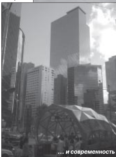
... и современность

но, конечно, было все: от ударной техники до философского отношения к залу, к тренировкам. В общем, хотелось узнать из первых рук, какую науку я должен преподавать здесь. Посмотреть, какие изъятия есть у меня в моем видении боя, преподавания. Самое главное, что я понял за 10 дней пребывания в Корее, что тхэквондо – это все-таки, в первую очередь, философия. И этой философией в Корее пропитано все.