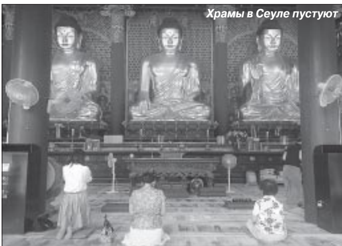
Храмы в Сеуле пустуют

Записал Руслан АБДУЛЛИН.