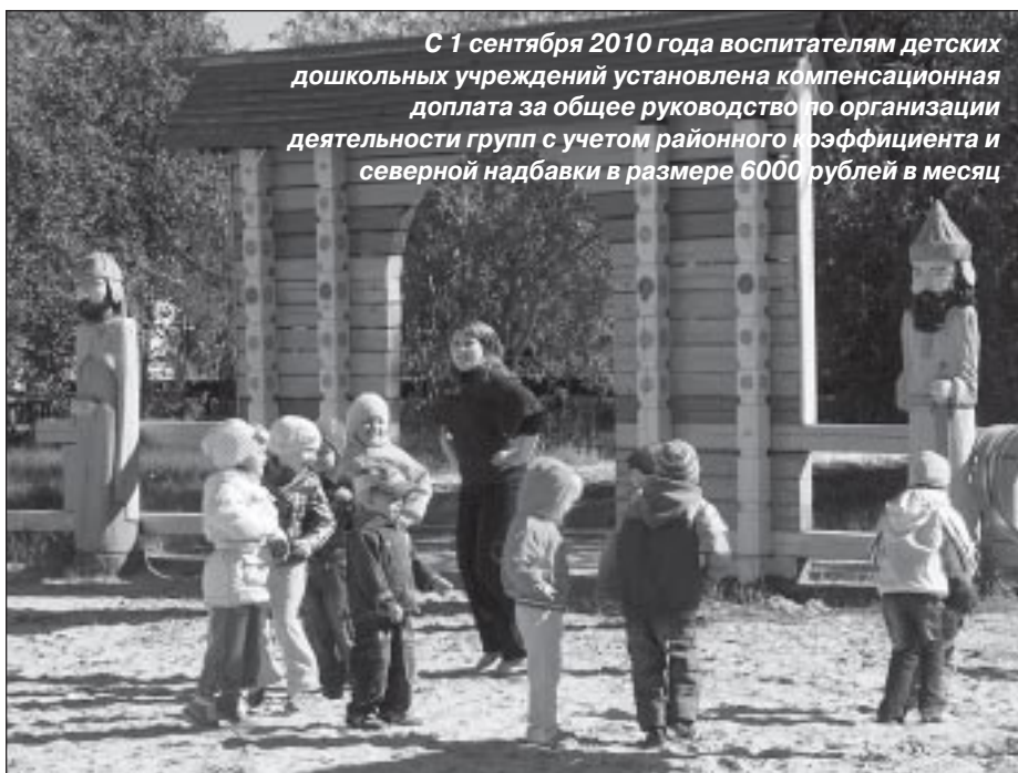
С 1 сентября 2010 года воспитателям детских дошкольных учреждений установлена компенсационная доплата за общее руководство по организации деятельности групп с учетом районного коэффициента и северной надбавки в размере 6000 рублей в месяц

систему оплаты труда учреждения дополнительного образования (детские школы искусств), подведомственные МУ «Управление культуры Пуровского района». Прогнозный рост среднемесячной заработной платы работников данных учреждений по сравнению с 2010 годом составит около 14 %.