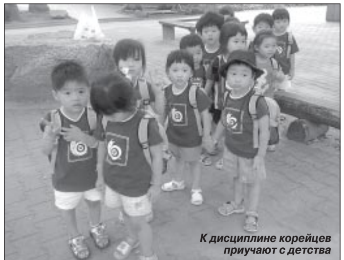
К дисциплине корейцев приучают с детства

Помните, как в фильмах уровень мастерства проверяют раз-