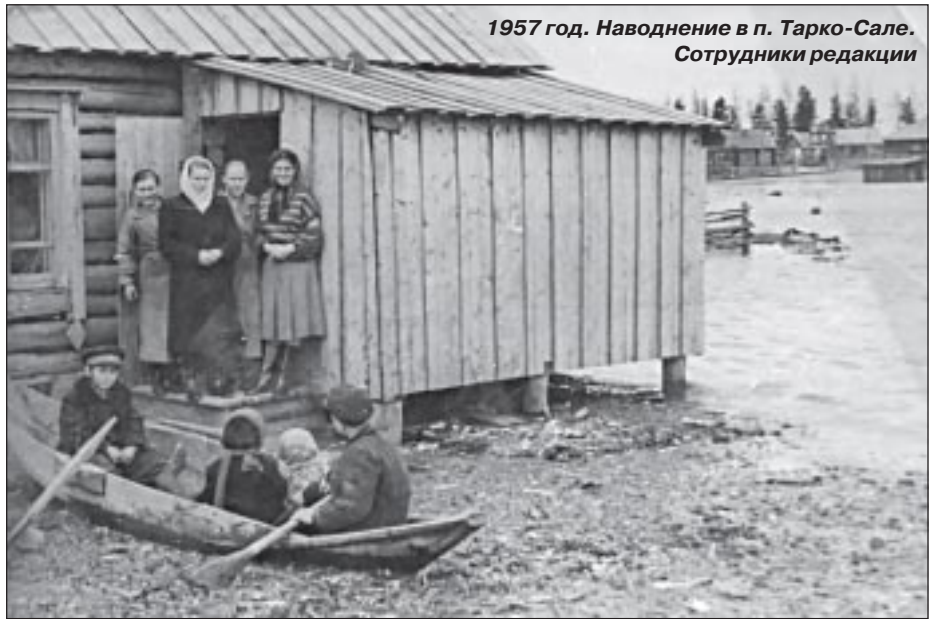
1957 год. Наводнение в п. Тарко-Сале. Сотрудники редакции