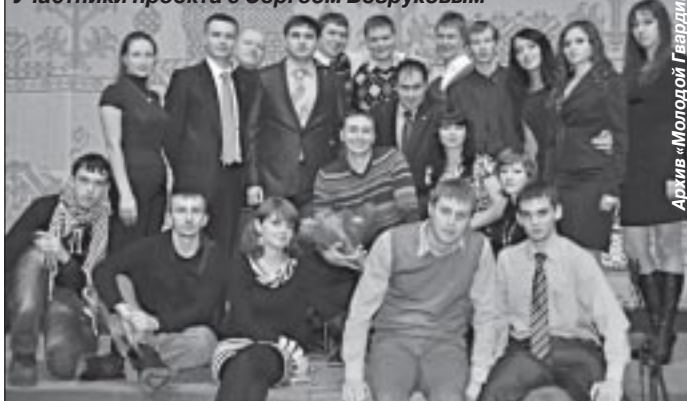
Участники проекта с Сергеем Безруковым