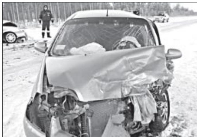
ДТП, произошедшее 4 декабря 2010 г. из-за нарушения правил дорожного движения