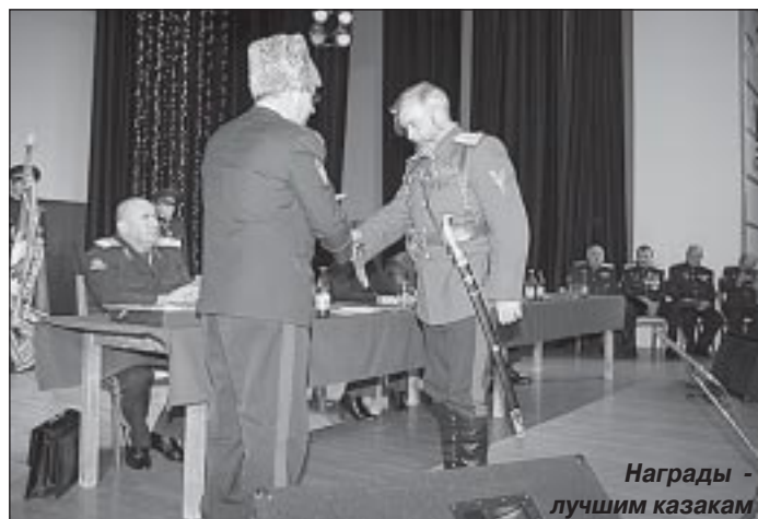
Награды - лучшим казакам

- обеспечение участия казачества в возрождении принципов общегражданского патриотизма, верного служения Отечеству на основе традиций казачества,