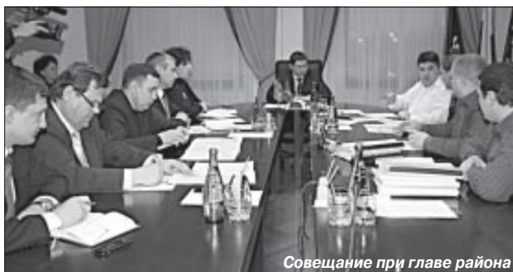
Совещание при главе района

Предстоящая реконструкция улиц включает в себя замену сетей тепловодоснабжения, связи, электросетей, газовых труб, но-