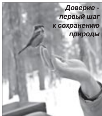
Доверие - первый шаг к сохранению природы

Проблема отношений человека и окружающей среды стала сегодня в ряд острых и неотложных забот человечества. Сохранить гармонию человека и природы - основная задача, стоящая перед молодым поколением.