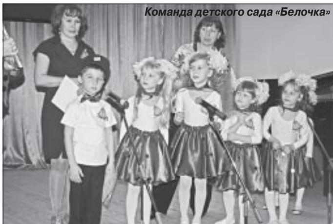
Команда детского сада «Белочка»

казали умение слушать и воспроизводить заданный ритм. Дети отлично справились с заданиями.