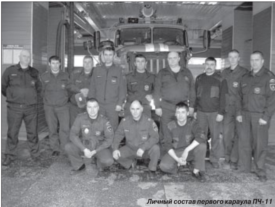
Личный состав первого караула ПЧ-11