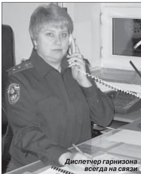
Диспетчер гарнизона всегда на связи