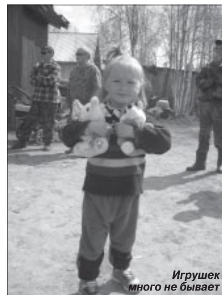
Игрушек много не бывает