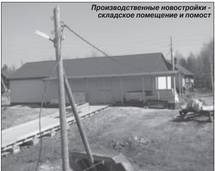
Производственные новостройки - складское помещение и помост