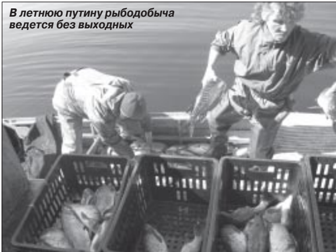
В летнюю пугину рыбодобыча ведется без выходных