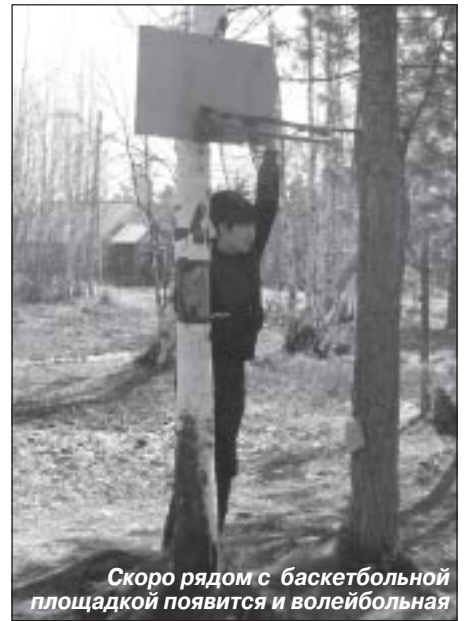
Скоро рядом с баскетбольной площадкой появится и волейбольная

Чтобы проводить гостей и поблагодарить их за подаренный праздник, вышло еще больше быстринцев, чем было при встрече.казалось, что именно на