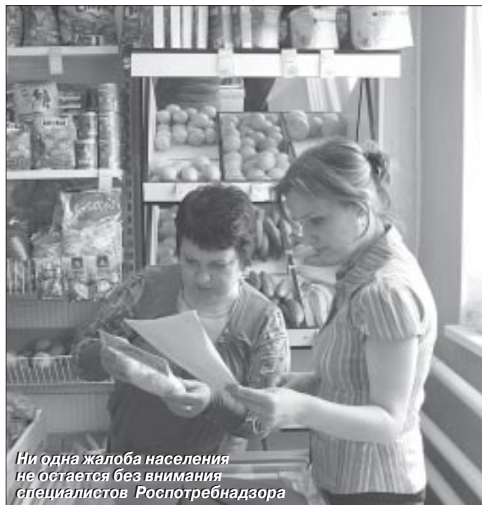
Ни одна жалоба населения не остается без внимания специалистов Роспотребнадзора

Бесспорно, свою роль в наметившейся тенденции к снижению сыграло то, что прокурором Пуровского района 14 октября 2010 года было дано поручение (№ 2700/07) выявлять факты нарушений правил розничной торговли пива и напитков, изготовленных на его основе, в соответствии с которыми реализация этих напитков, а тем паче другой алкогольной продукции несовершеннолетним запрещена. После этого в Пурпе была проведена большая разъяснительная работа с предпринимателями – на этом вопросе был сделан особый акцент на двух последних совещаниях при первом замес-