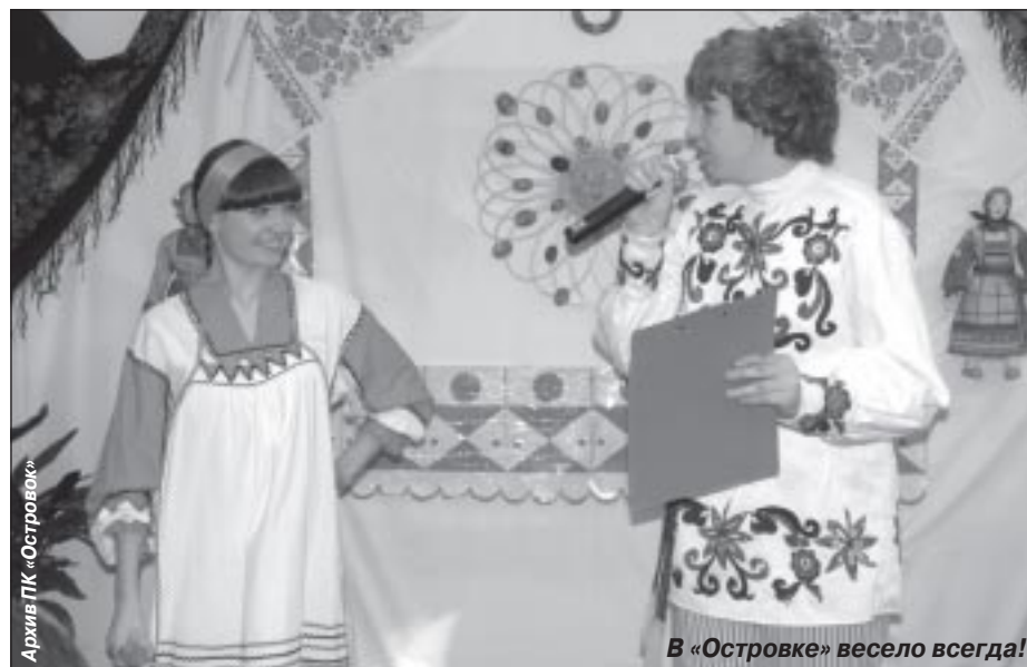
Архив ПК «Островок»