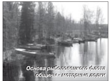
Основа рыболовецкого флота общины - моторные лодки

эти последние минуты пришлось самое большое количество неотложных разговоров, просьб передать приветы и пожелания. А сколько возле вертолета прозвучало при-