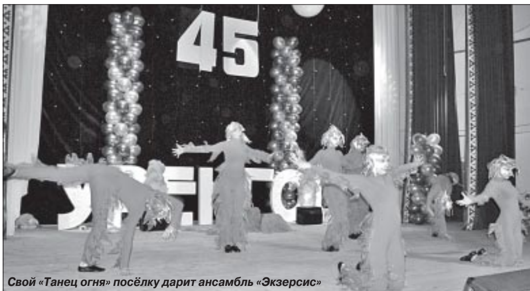
Свой «Танец огня» посёлку дарит ансамбль «Экзерсис»