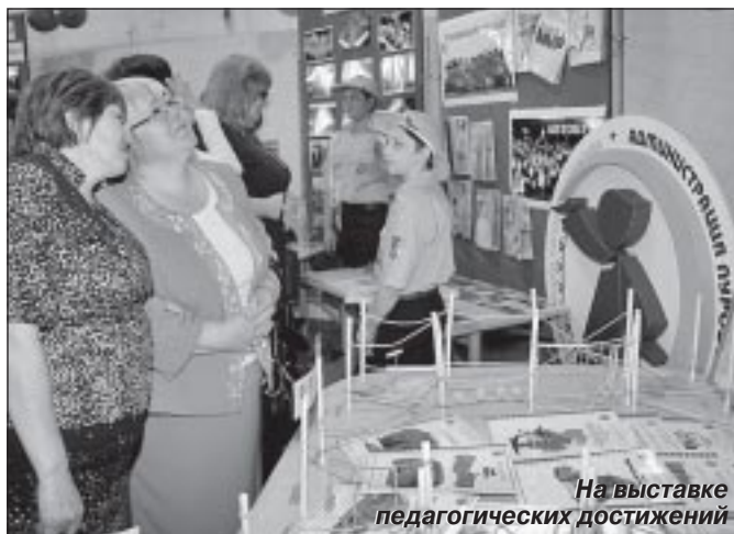
На выставке педагогических достижений

После перерыва состоялись заседания секций, в ходе которых прошла публичная защита инновационных проектов, вызвавшая массу вопросов, обнажившая все тон-