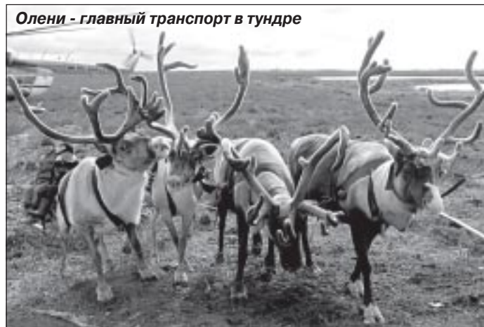
Олени - главный транспорт в тундре

вываться непременно. Пусть их визит будет затратен по деньгам. Но скажите, кто сможет подсчитать стоимость радости и счастья, подаренного пастухам и чумработницам, оказанного им уважения?