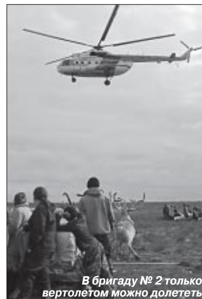
В бригаду № 2 только вертолетом можно долететь

Поводом для приезда к кочевникам полномочного представителя губернатора ЯНАО Марии Всеволодовны Ворониной, заместителя начальника управления по делам малочисленных народов Севера ад-