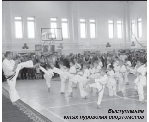
Выступление юных пуровских спортсменов

Кроме того, на каждой секции руководителей обсуждался вопрос о переходе ОУ в новый правовой статус. Школы, детские сады, дома детского творчества и межшкольные