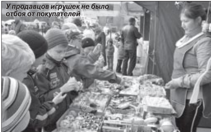
У продавцов игрушек не было отбоя от покупателей

Е. ЛОСИК, С. ИВАНОВА, фото А. СУХОРУКОВОЙ