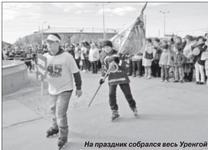
На праздник собрался весь Уренгой

ся на площади перед КСК «Уренгоец» (ее жители любовно окрестили «Фонтанкой») за долго до начала торжественных мероприятий. По улицам курсировала разукрашенная машина, откуда доносились призывы принять участие в гу-