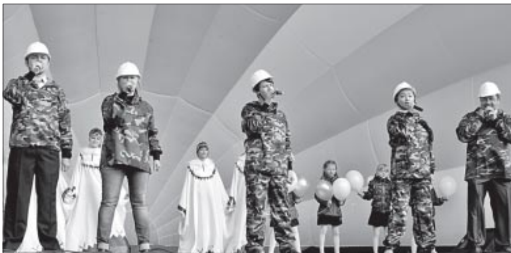
Славим геологов! Славим нефтяников! Славим Уренгой!

Продолжились торжественные мероприятия непосредственно на «Фонтанке». Здесь гости праздника также обратились к собравшимся с приветственными словами. «Уренгойцы открыли для страны более 100 месторождений нефти и газа, - поздравил юбиляров Евгений Скрябин, - четыре из которых – Уренгойское, Ямбургское, Южно-Русское и Юбилейное являются поистине уникальными. Сегодня у поселка открылось второе дыхание – он активно развивается, строятся новые