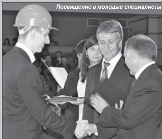
Посвящение в молодые специалисты

Д. ЯМАЛЬСКАЯ