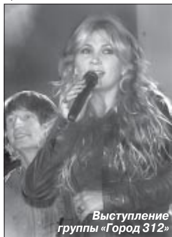
Выступление группы «Город 312»

Рядом с площадью проходили праздничные посиделки «Захо-