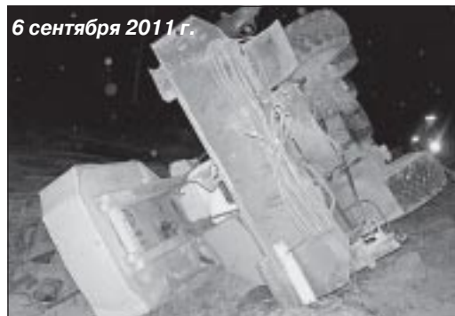
6 сентября 2011 г.