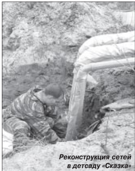
Реконструкция сетей в детсаду «Сказка»