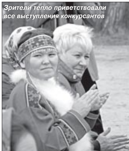
Зрители тепло приветствовали все выступления конкурсантов

Представление номинаций и работа жюри были разделены на два дня. Первый день прошел в КСК «Геолог». Открылся фестиваль номинацией «Ямальские забавы: национальная игрушка». Более тридцати конкурсантов представили мастерские творения на суд зрителей и жюри. Все работы были изумительной красоты! Абсолютно все они были выполнены в материалах, традиционно