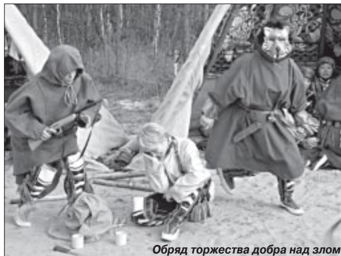
Обряд торжества добра над злом

Вечером наступил самый торжественный момент – награждение победителей. По мнению компетентного жюри, титулов обла-