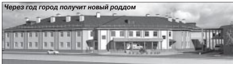
Через год город получит новый роддом