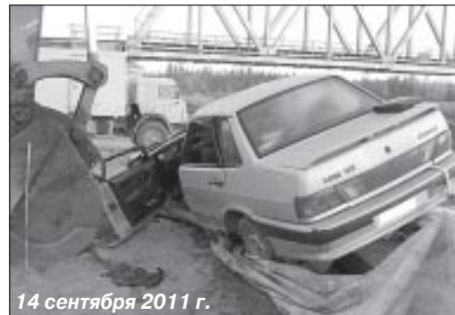
14 сентября 2011 г.