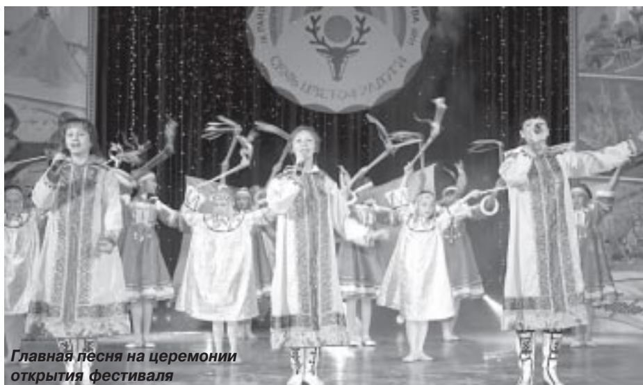
Главная песня на церемонии открытия фестиваля

17-18 сентября в городе Тарко-Сале прошел IX районный открытый фестиваль творчества финно-угорских и самодийских народов «Семь цветов радуги», посвященный Году равных возможностей.