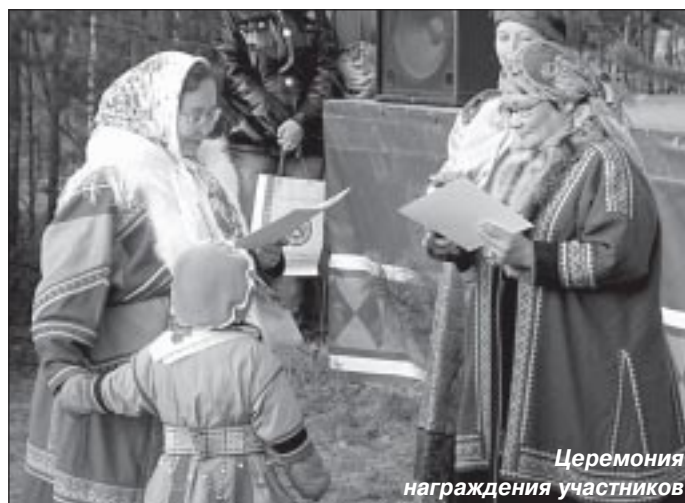
Церемония награждения участников

устный и песенный фольклор, традиционный обряд». Номинанты очень искренне исполнили фольклорные песни, которые некогда пелись в различных жизненных ситуациях, а затем показали несколько национальных событийных обрядов.