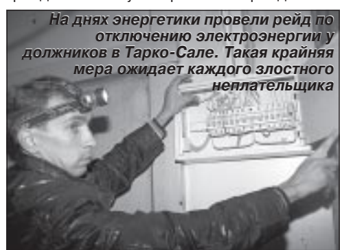
На днях энергетики провели рейд по отключению электроэнергии у должников в Тарко-Сале. Такая крайняя мера ожидает каждого злостного неплательщика

В результате незаконного потребления электроэнергии страдают, как правило, добросовестные граждане: во-первых, именно им приходится оплачивать украденную соседом электроэнергию, во-вторых, в домах, где орудуют нелегальные потребители, чаще всего происходят спады либо скачки напряжения и разного рода сбои в системе подачи электроэнергии, что часто является причиной возникновения пожаров и перегоревшей бытовой техники в квартирах граждан. Поэтому мы призываем граждан быть бдительными и сообщать энергетикам о подозрениях или фактах хищения электроэнергии.