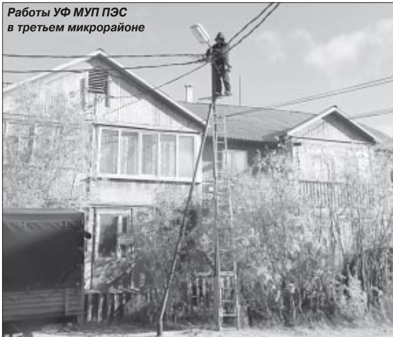
Работы УФ МУП ПЭС в третьем микрорайоне

Три миллиона рублей на подготовку своих объектов к зиме получил Уренгойский филиал МУП ПЭС. Основная часть этих средств – 1,76 млн. рублей – затрачена на ремонт, испытание и наладку оборудования после проведенных работ на подстанции «Юность». Остальные денежные средства пошли на проектирование и наладку электрических сетей, замену опор электропередач.