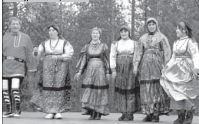
Обладатели Гран-при «Самбургские зыряночки»

Далее творческие коллективы и отдельные участники пригласили всех присутствующих посмотреть и послушать выступления одной из самых сложных номинаций «Путешествие вглубь веков: