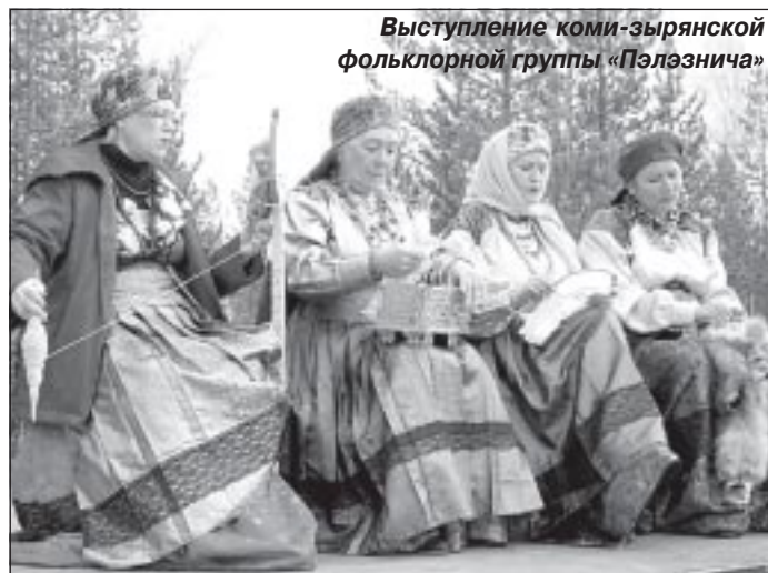
Выступление коми-зырянской фольклорной группы «Пэлэзничка»

Завершил фестивальную эстафету первого дня конкурс исполнителей эстрадной песни на русском и родном языках. Главным