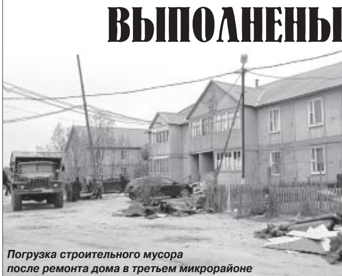
Погрузка строительного мусора после ремонта дома в третьем микрорайоне

11,5 млн. рублей. При этом на ремонт котельных затрачено 2,5 млн. рублей, на монтаж и утепление трубопроводов протяжённостью 485 метров – 7,5 млн. рублей; 1,5 млн. рублей – на проведение изыскательских работ, обустройство и реконструкцию дополнительной скважины с установкой насоса для обеспечения качественной питьевой воды. Оборудование котельных, от работы которых в первую очередь зависит тепло в помещениях, ежегодно подвергается диагностированию