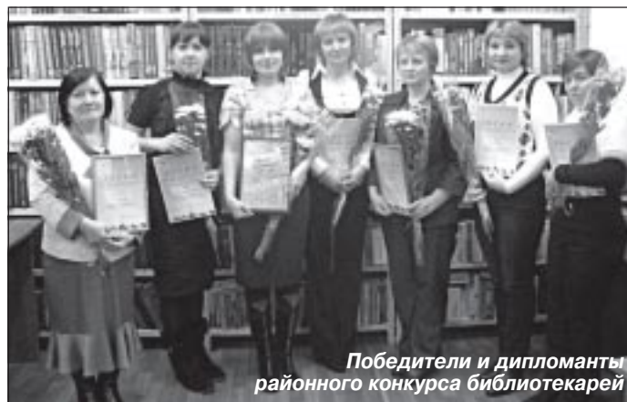
Победители и дипломанты районного конкурса библиотекарей

23 ноября были оглашены итоги конкурса. В номинации «Лучшая библиотека по количественным показателям электронных ресурсов среди библиотечных учреждений Пуровского района» первое место заняло муниципальное бюджетное учреждение «Библиотечная система Пурпе».