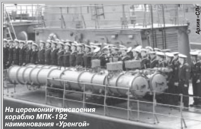
На церемонии присвоения кораблю МПК-192 наименования «Уренгой»

Шефские связи между администрацией Пуровского района и командованием военно-морской базы Балтийского флота были установлены в 2008 году. Прохождение срочной военной службы