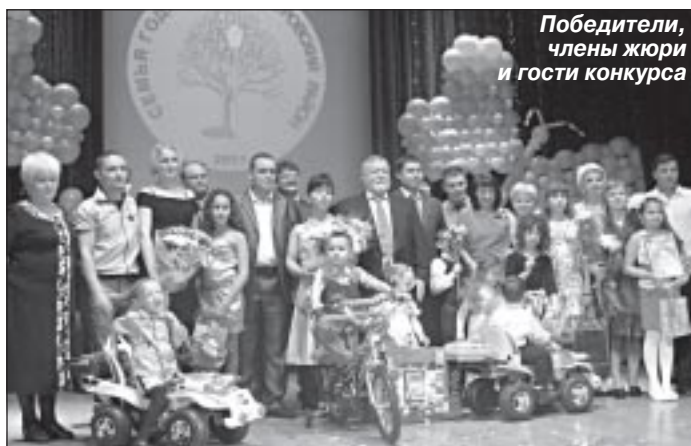
Победители, члены жюри и гости конкурса