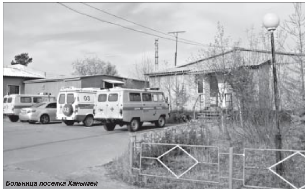
Больница поселка Ханымей

Начинать работу в поселке приходилось в тяжелых условиях. В фельдшерско-акушерском пункте не было ни медоборудования, ни автотранспорта. Ближайшие больницы находились в 350 километрах – в п. Тарко-Сале и в 500 км – в Сургуте. Не раз и