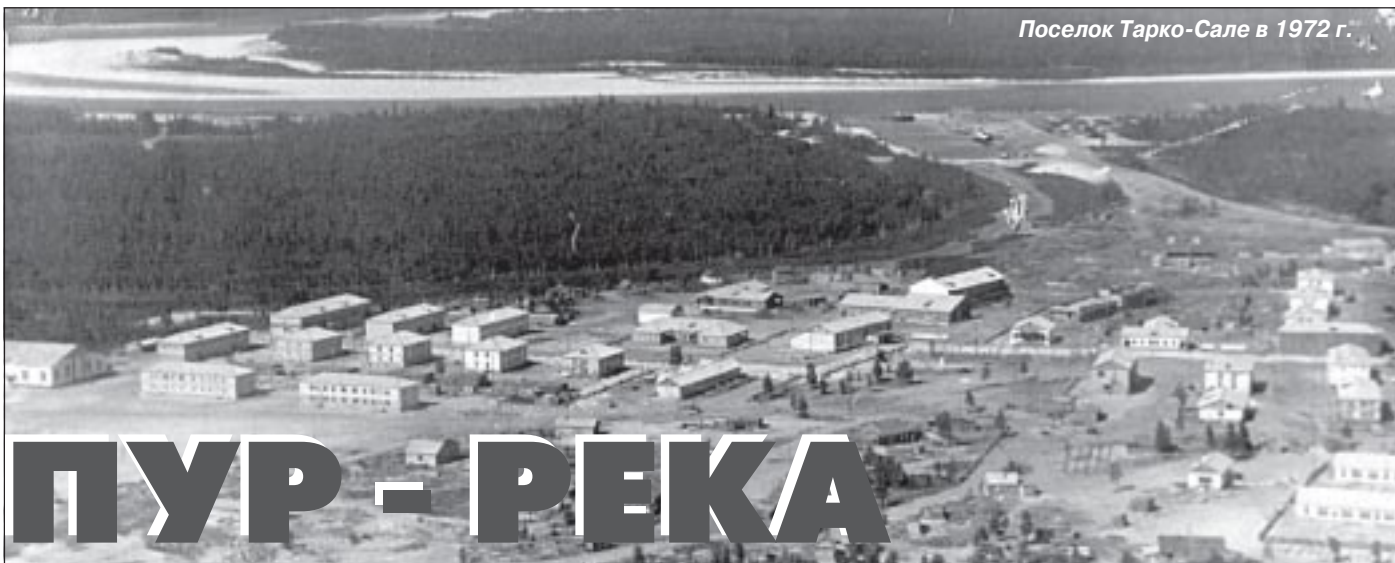
Поселок Тарко-Сале в 1972 г.