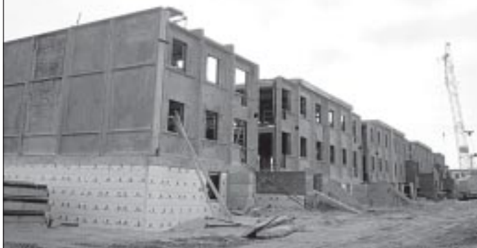
Ханымей: при поддержке Фонда строится 45-квартирный дом

переселения жителей Пуровска в достойное жилье можно только одним действенным способом - возведением новых домов. Работа в этом направлении начата. Сейчас в поселке уже ведутся земельные работы на месте будущего фундамента для многоэтажного жилого дома.