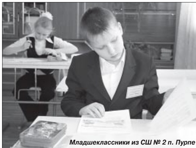
Младшеклассники из СШ № 2 п. Пурпе

- Сначала вкратце поясню, в чем заключается сам процесс создания школ-ступеней. Есть два варианта, по которым можно реализовывать это направление. Первый - создавать школы-ступеней на базе разных образовательных учреждений, являющихся самостоятельными юридическими лицами. По этому пути пошли в Муравленко. Второй - реализовывать все три модели на базе одного учреждения. В этом случае создается образовательное пространство для каждой ступени, определенным образом выстраивается си-