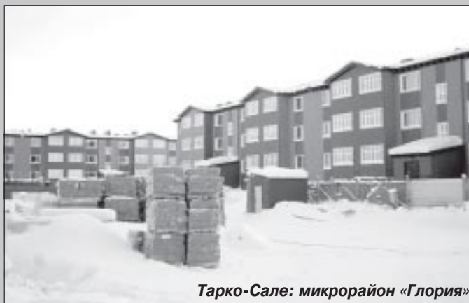
Тарко-Сале: микрорайон «Глория»

С 14 февраля начнется заявочная кампания. Граждане, желающие принять участие в программах, должны обратиться в местные управления и отделы жилищной политики, предоставить необходимый пакет документов. О номере в списке участников программы оповестят дополнительно после 1 августа текущего года. В некоммерческой организации «Фонд жилищного строительства Ямало-Ненецкого автономного округа» организован телефон горячей линии: 8 (34922) 3-92-70. Консультации по программам ведутся с 8.30 до 12.30 и с 14.00 до 18.00.