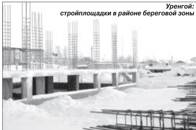
Уренгой: стройплощадки в районе береговой зоны

Для представления масштабов настоящего и грядущего строительства для переселения уренгойских граждан из ветхого и аварийного фонда команда