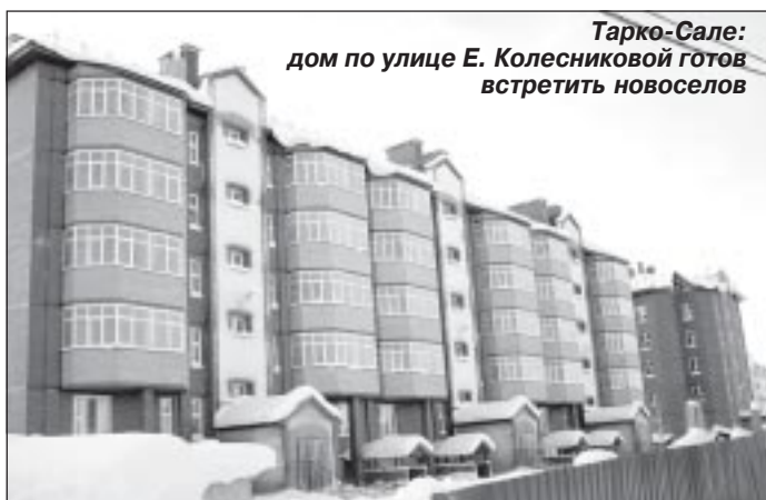
Тарко-Сале: дом по улице Е. Колесниковой готов встретить новоселов

женности, поскольку большинство проживающих в ветхих и аварийных домах граждан не может в настоящее время самостоятельно приобрести или получить на условиях найма жилье удовлетворительного качества.