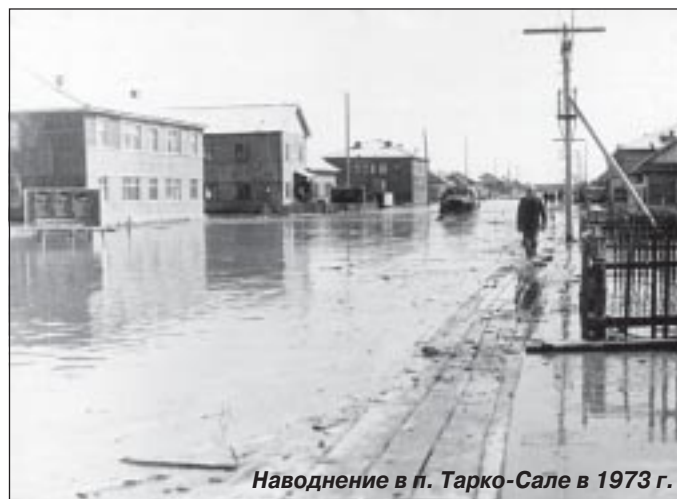
Наводнение в п. Тарко-Сале в 1973 г.

Кулаки и шаманы обещали тем, кто «не будет работать на русских, будут всегда их поддерживать, дадут им оленей», но их обещания в большинстве своем оставались пустыми словами. Долго и кропотливо приходилось нам разъяснять беднякам и серед-