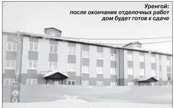
Уренгой: после окончания отделочных работ дом будет готов к сдаче

Сегодняшняя встреча с руководством Фонда была очень нужна. Имелись вопросы, которые требовалось обсудить не в интерактиве, а в реальной обстановке. Существовала потребность внести ясность в механизм сноса домов, варианты определения потенциального застройщика, рассмотрение других важных тем. Поскольку работа в рамках программы начата недавно, была необходимость в регулировании механизма передачи готового к эксплуатации жилья собственникам или нанимателям. Считаю, что совещание прошло продуктивно. Нами сообщи был намечен путь реализации программ, порядок дальнейшего взаимодействия в интересах жителей Уренгой».