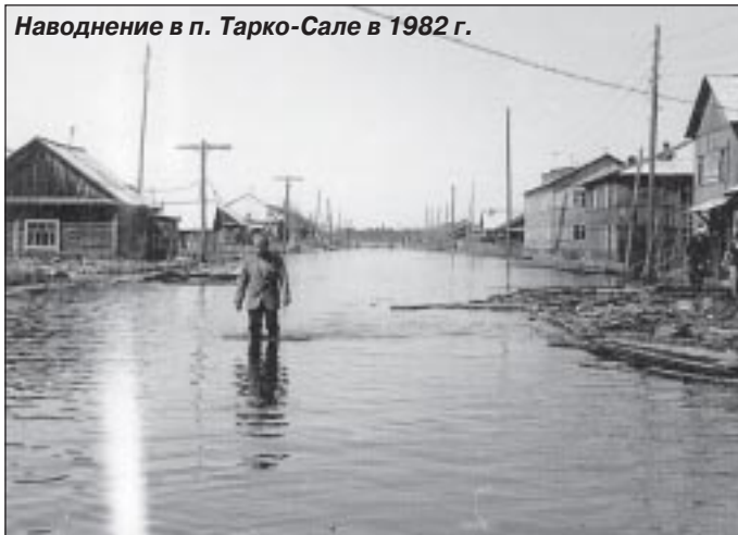
Наводнение в п. Тарко-Сале в 1982 г.

ты маленький железный ящик, в котором возил документы и деньги, и заставили пойти в чум.