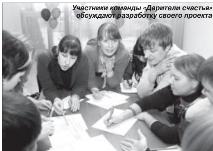
Участники команды «Дарители счастья» обсуждают разработку своего проекта

В преддверии выборов Президента Российской Федерации департамент молодежной политики и туризма ЯНАО, совместно с Окружным молодежным центром, региональной общественной организацией «Ассоциация детских и молодежных общественных объединений Ямала» и управлением молодежной политики и туризма администрации Пуровского района провели молодежный общественно-политический агитдесант «Присоединяйся!» Цель этого мероприятия - повышение электоральной активности молодых избирателей и формирование гражданско-правовой культуры молодежи автономного округа.