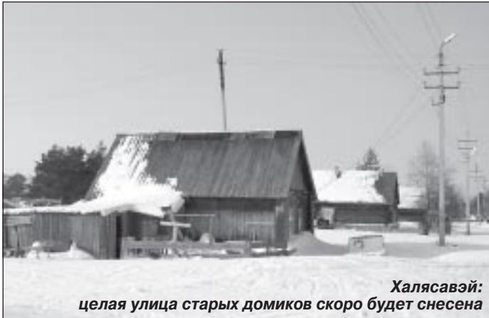
Халясавэй: целая улица старых домиков скоро будет снесена

ния снегоходной техники, лодочных моторов, сетей и многого другого. Ему нужна придомовая территория, где можно будет привязать оленей. Поэтому в Самбурге основной фонд должен состоять из двух - максимум - четырехквартирных домов».