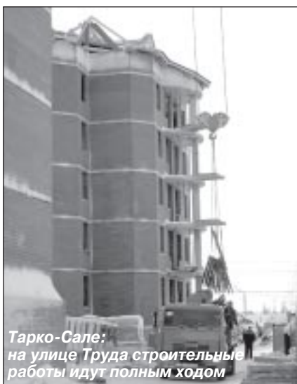
Тарко-Сале: на улице Труда строительные работы идут полным ходом

Каждый раз, собираясь писать материал, журналист ориентируется на своего потенциального читателя. Молодежная тематика интересна именно молодежи, вопросы деятельности предприятий нефтегазовой отрасли или инноваций в медицине привлекут внимание специалистов этих сфер. Список тем и читательских категорий можно продолжать бесконечно. Но на протяжении столетий существует интересующая всех людей жилищная тема.