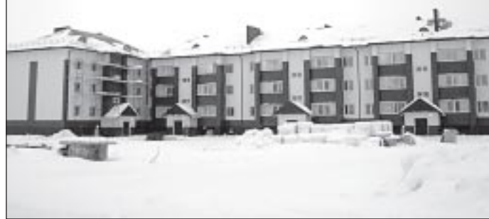
Пурпе: дом на улице Школьной сдается в эксплуатацию в I квартале 2012 года

покосившаяся избушка может вызвать у лирически настроенного наблюдателя (но только не у жителя этой избы!) даже некоторую сентиментальность и ностальгию по прошлому, то в городском пейзаже перекошенные строения выглядят уродливо. Наличие подобных зданий на улицах Тарко-Сале сдерживает развитие городской инфраструктуры, понижает инвестиционную привлекательность территории. Кроме того, ветхий и аварийный фонд является одним из источников социальной напря-