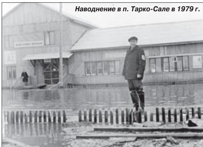
Наводнение в п. Тарко-Сале в 1939 г.

На другой день утром, позавтракав, стали ловить оленей, чтобы поехать к реке. Когда мои олени были уже пойманы и я их запрыг, из мелкого соснового леса выехали одна за другой двенадцать оленьих упряжек во главе с тем ненцем, что был у нас вечером. Подъехали ко мне. Не успел я опомниться, как из чехла, притороченного к моей нарте вытащили винтовку, отвязали с нар-