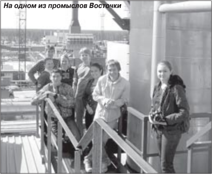
На одном из промыслов Восточки

ния к нам предъявлялись серьезные. Подготовка к семинарам и практическим занятиям занимала почти все свободное время. Приходилось нелегко, чтобы сдать сессию без троек, необходимо было прикладывать большие усилия. Завидовала тем, кто не учится в вузе, но понимала, надо обязательно получить образование, это - путевка в жизнь.