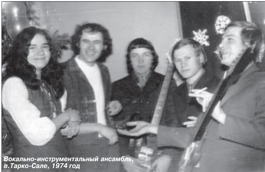
Вокально-инструментальный ансамбль, п. Тарко-Сале, 1974 год