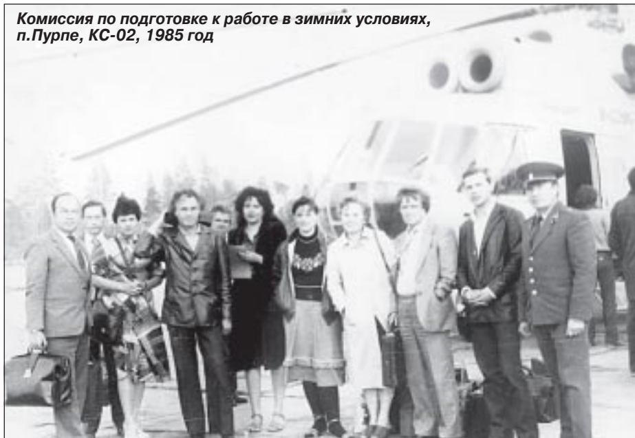
Комиссия по подготовке к работе в зимних условиях, п.Пурпе, КС-02, 1985 год

12.45-13.00 - развлекательно-игровой блок «Игры - конкурсы- викторины».