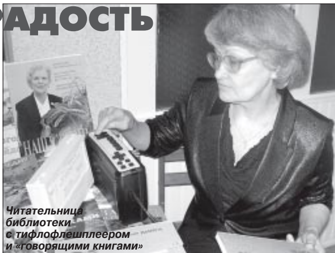
Читательница библиотеки с тифлофлешплеером и «говорящими книгами»

Также для тифлофлешплееров были приобретены цифровые аппаратно-программно-защищенные «говорящие книги» для инвалидов по зрению на флеш-картах в количестве 389 книг. Это - художественные произведения русских и зарубежных авторов для различных групп пользователей (взрослых и детей) разного жанрового содержания: детектив, исторический роман, фэнтези, любовный роман, поэзия, русская и зарубежная проза таких авторов, как Б.Акунин, А.Аверченко, В.Аксёнов, Ч.Абдуллаев, Д.Балашов, В.Орлов, В.Распутин, А.Лиханов, А. и Б.Стругацкие, А. и Г.Вайнеры, В.Лавров, В.Кра-