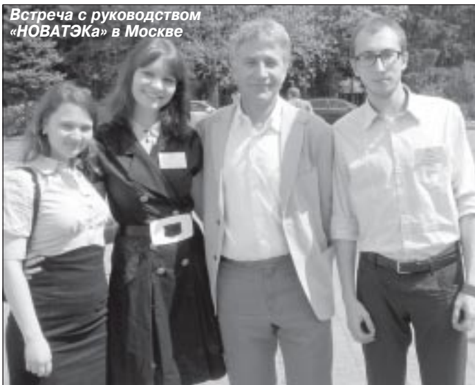
Встреча с руководством «НОВАТЭКа» в Москве