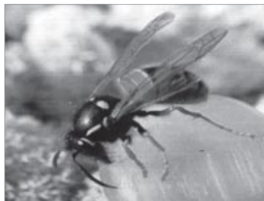
▼ Фотоэтюда А. Мосиенко

девятого сентября. А ещё сотрудники музея попросили напомнить, что теперь его двери открыты для зрителей каждый день, кроме понедельника, с десяти часов утра до половины восьмого вечера, а в субботу и воскресенье - с половины первого дня также до половины восьмого вечера. Увидеть прекрасное - это так просто... ■