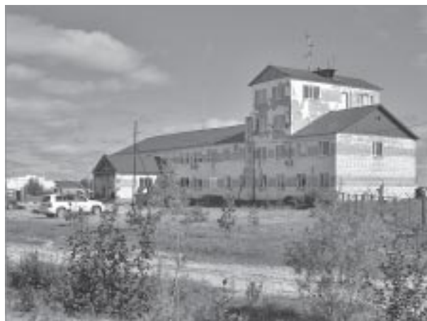
▲ Здание аэропорта

Руководство предприятия, конечно, предпринимало попытки хоть как-то сдвинуть дело с мертвой точки. С помощью районной администрации было создано муниципальное предприятие «Аэропорт «Урен-