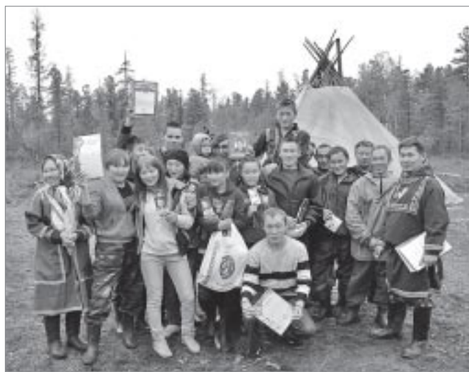
По материалам пресс-службы губернатора ЯНАО и собственных корреспондентов