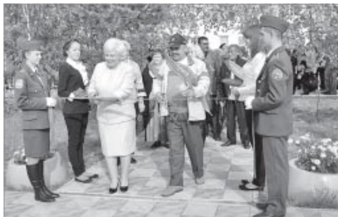
▲ Открытие мемориала основателям Ханымей