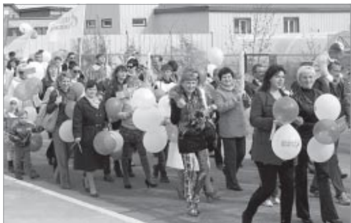
▲ Праздничное шествие