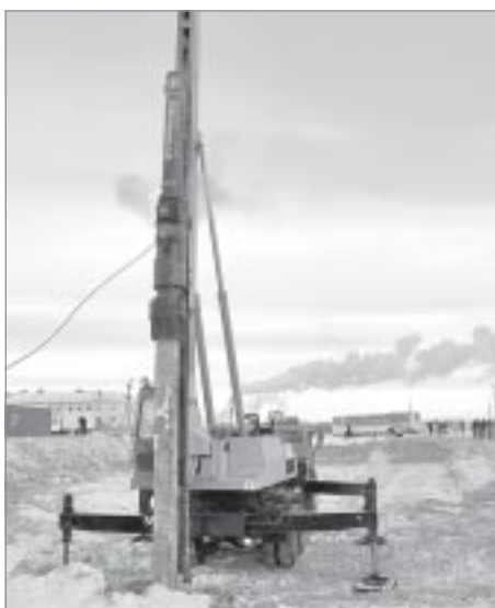
▲ Первая свая в основание нового микрорайона

Окончание материала о семинаре окружных СМИ читайте в следующем номере.