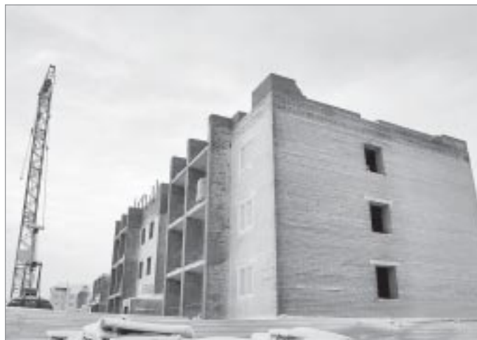
▲ В 2013 году будут введены в эксплуатацию два жилых дома в капитальном исполнении

Следующим участники совещания обсудили вопрос предо-