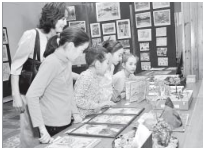
▲ Часть конкурсных работ была выставлена в фойе КСК «Геолог»

Как председатель жюри конкурса, хочу отметить, что, согласно протоколу, первые места заняли 11 человек, вторые - 17, третьи - 15, поощрительными призами отмечены 113 авторов. На церемонии награждения особенно трогательно выглядели победители в номинациях, стоявшие на сцене рядом - первоклассники и пенсионеры. Это еще раз подчеркивает, что люди разных возрастов и разных способностей в конкурсе имели равные возможности для самовыражения, подошли к работе творчески и ответственно. Победителям были вручены грамоты, цветы и денежные премии, руководителям коллективов дополнительного образования - благодарственные письма, участникам - благодарности и мягкие игрушки.