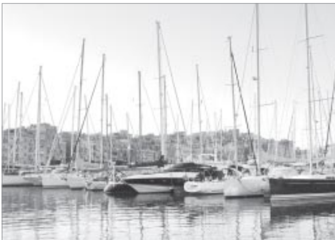
▼ Бухта города Слива поражает своей красотой

Эти 12 дней пролетели очень быстро. По завершении обучения в англоязычной школе нам всем выдали сертификаты, подтверждающие уровень владения иностранным языком. Эта поездка стала не только культурно-познавательной для ребят, она помогла осознать необходимость продолжения изучения английского языка, а для отличников учебы - стимулом быть лучшими во всем.