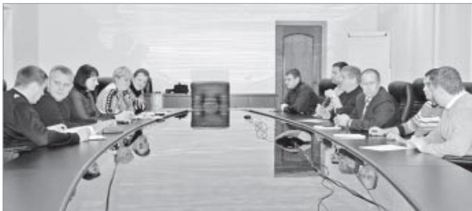
▲ На заседании профкома ООО «НОВАТЭК-ТАРКОСАЛЕНЕФТЕГАЗ»

- Будущее профсоюзов - за молодежью. Впереди много важных и нужных дел. Молодое поколение является одним из важных ресурсов страны, во все времена было и остается генератором новых идей, планов, свежих и нестандартных решений. ■