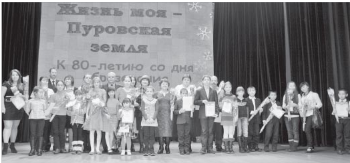
▼ Общее фото на память победителей конкурса в номинациях после церемонии награждения

Конкурс показал, что Пуровская земля действительно богата творческими людьми и развитие их талантов надо поощрять. ■