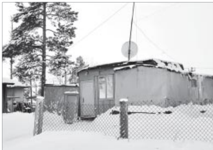
▲ В этом году из балков и вагонов расселены 22 семьи, 68 - ждут решения вопроса

В рабочем режиме на совещании обсуждены и другие вопросы. Говорилось о необходимости проведения экспертизы газопровода, обеспечивающего поселение, подаче газа в микрорайон Строитель, ремонте водонапорной скважины. По ним также приняты соответствующие решения.