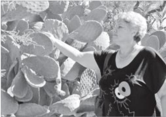
▲ Ягоды плоского кактуса вкусны и полезны

Богатые кружева, плетенные коклюшками, красивейшая стеклянная посуда, которой нет аналогов в мире, и изделия из серебра - изблюбленные сувениры туристов. Также популярны в качестве подарков модели парусников, кораблей и лодок.