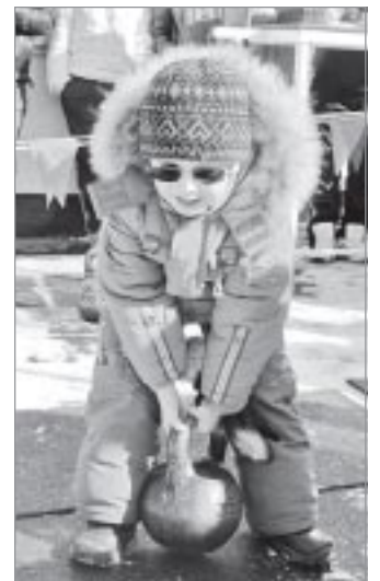
Подрастающий Геркулес из Тарко-Сале

Основное же спортивное состязание происходило на хоккейном корте первой школы. Здесь состоялся открытый турнир по хоккею на Кубок главы