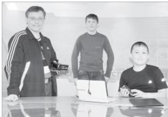
В съемочном павильоне ВГТРК «Вести-Чувашия»