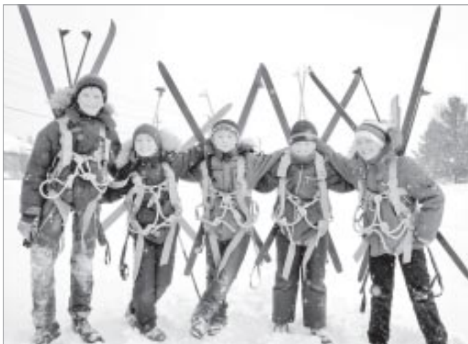
Ребята из туристского кружка «Узелок»

Только подводя итоги завершающегося учебного года, педагоги Дома детского творчества уже говорят о будущем. В планах у сотрудников и их воспитанников - развитие конструирования и робототехники.