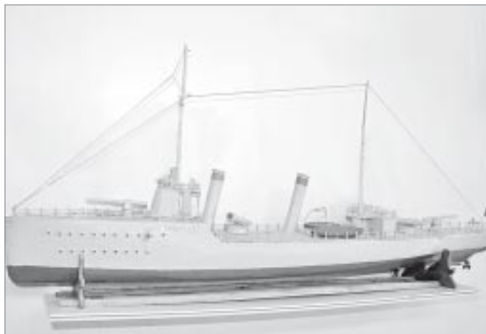
Эскадренный миноносец «Амурец», начало XX века