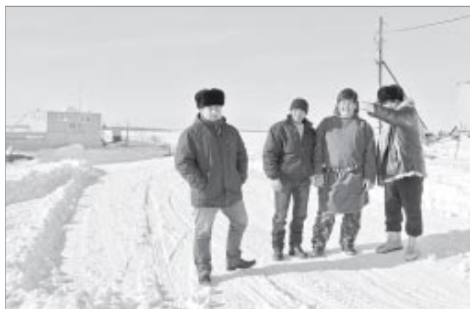
На территории базирования речного флота совхоза

Вертолетная площадка в Самбурге расположена на территории рощи - небольшим лесном массиве, сразу за которым берег реки Пур. Там, на песчаном мысу, базируется флот совхоза. Показать мощь речной флотилии мужчинам-землякам из других