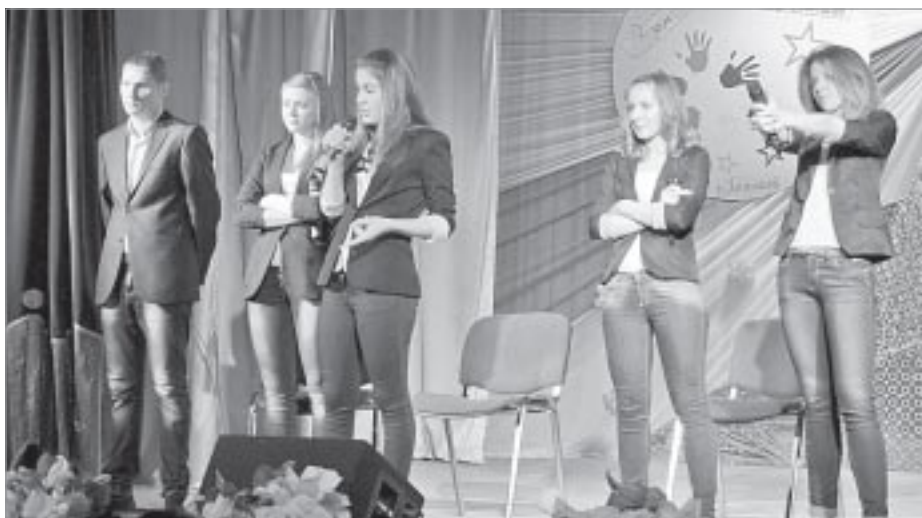
Известная команда КВН «Та самая»

Кроме веселых и находчивых, в зале кого только не было: от Кашея Бессмерт-