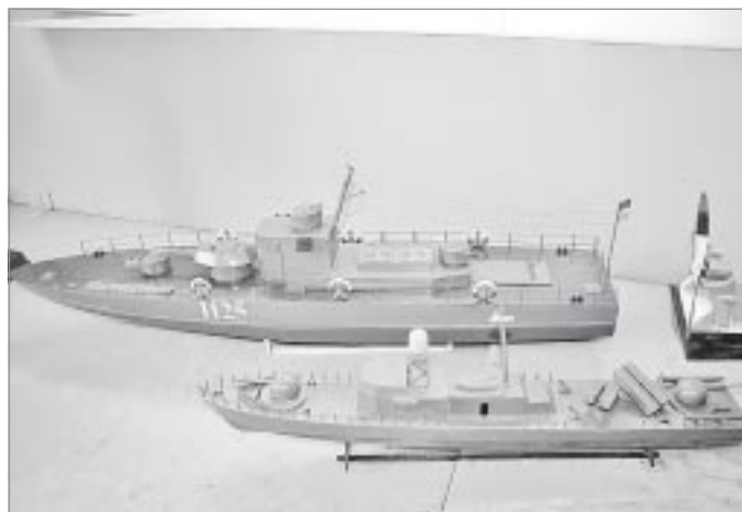
Катер-1125 - так называемый «плавающий танк» и ракетный катер времен Великой Отечественной войны