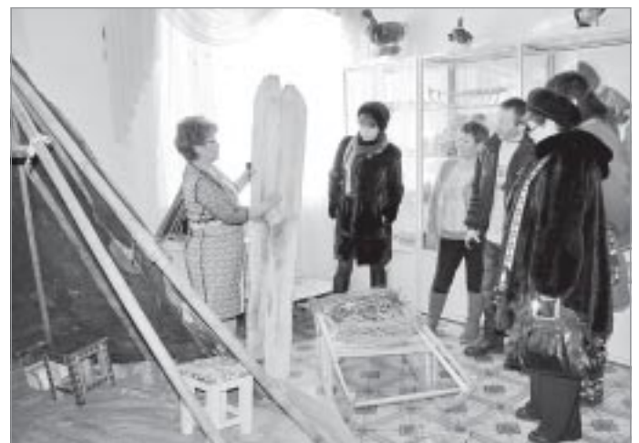
В музее школы-интерната

Пока члены делегации шли к вахтовке, несколько любопытных экскурсантов успели-таки заглянуть на несколько минут в возведенный поблизости деревянный двухэтажный дом. Наскоро ог-