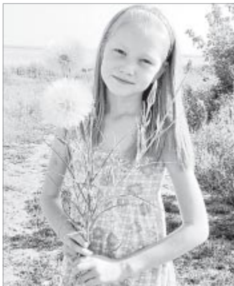
Вот такие одуванчики в Саратове