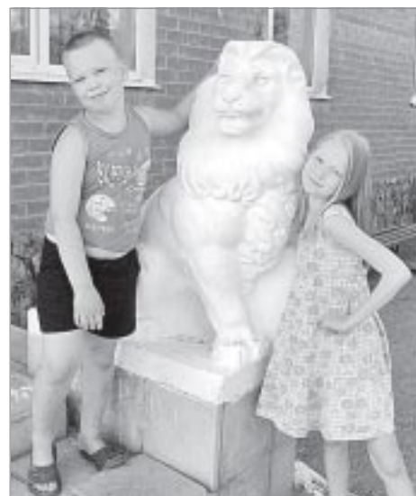
Этот лев охраняет автозаправку в Башкирии

А еще наша машина - это наш чемодан. Я считаю его без-донным и невероятно вмести-тельным, с чем супруг, он же - главный и единственный води-тель в семье, совершенно не согласен. Поддержите меня: одно дело, когда тащишь покла-жу на себе, и совершенно дру-гое, когда вещи преспокой-ненько катятся в багажнике. К тому же, если ты на авто, есть куда положить купленные на бахче арбузы и дыни, затарить-ся на долгую зиму ароматным кубанским подсолнечным мас-