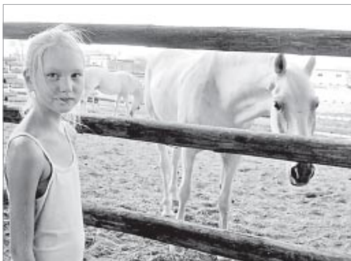
В «Казачьей слободе» в Ростовской области

пробел мы исправили. Уже на обратной дороге чада напрочь заменили в своем лексиконе мили на километры.