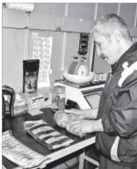
Продукция цеха по переработке рыбы и мяса

развить эту тему не дали женщины, да и некогда было рассуждать о преимуществах подобного устройства дома, поскольку уже прибыли на место.