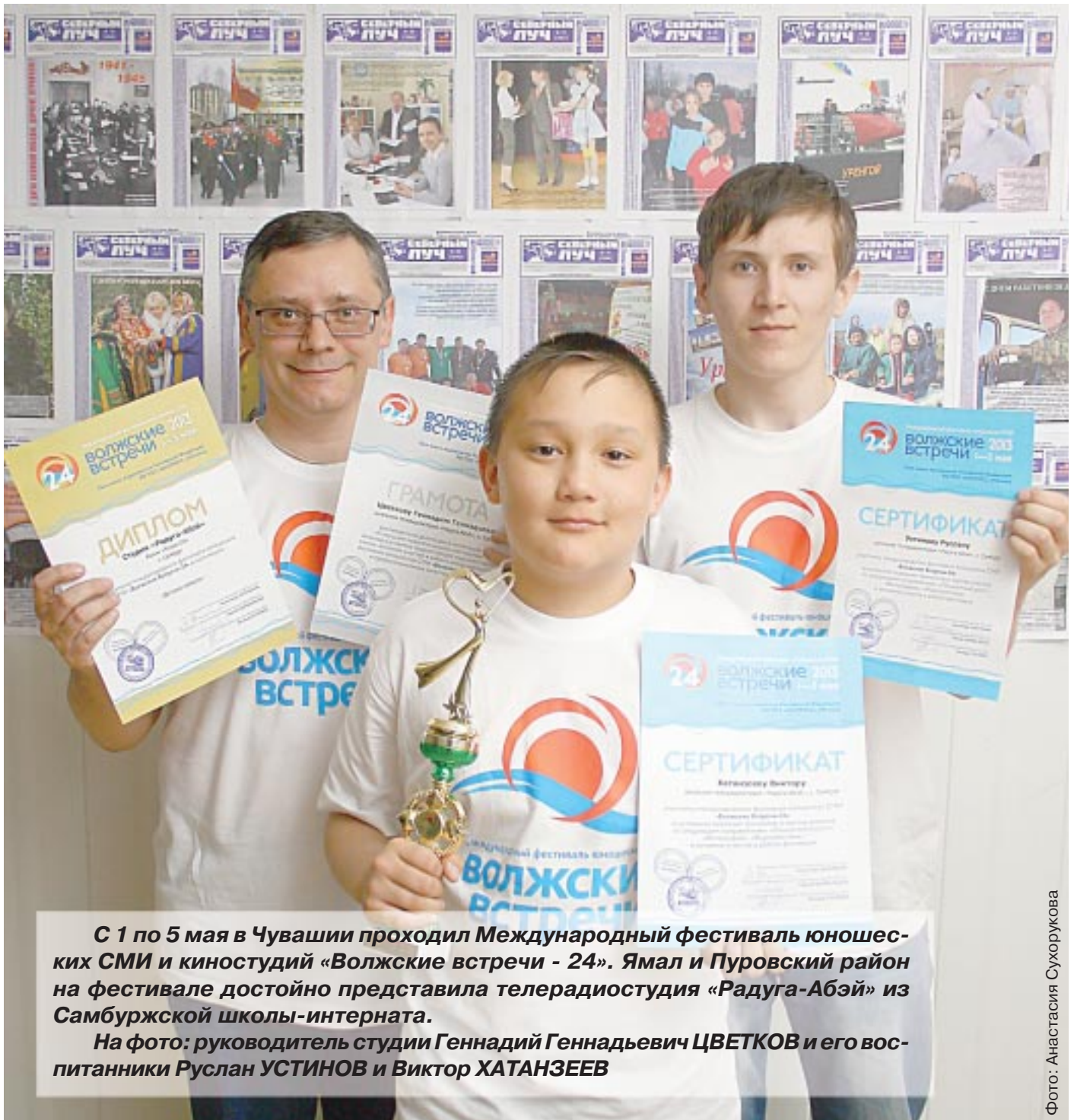
С 1 по 5 мая в Чувашии проходил Международный фестиваль юношеских СМИ и киностудий «Волжские встречи - 24». Ямал и Пуровский район на фестивале достойно представила телерадиостудия «Радуга-Абэй» из Самбуржской школы-интерната.

На Ямал лето приходит позже, начало пожароопасного сезона еще не объявлено. Но подготовка идет полным ходом.