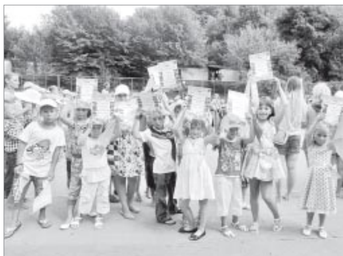
Итоговое награждение на закрытии смены

Отдельным мероприятием было выступление ребят детской хоровой студии «Синяя птица» из Дома детского творчества г.Тарко-Сале. Недаром по совету руководителя студии Ж.В. Образцовой мы