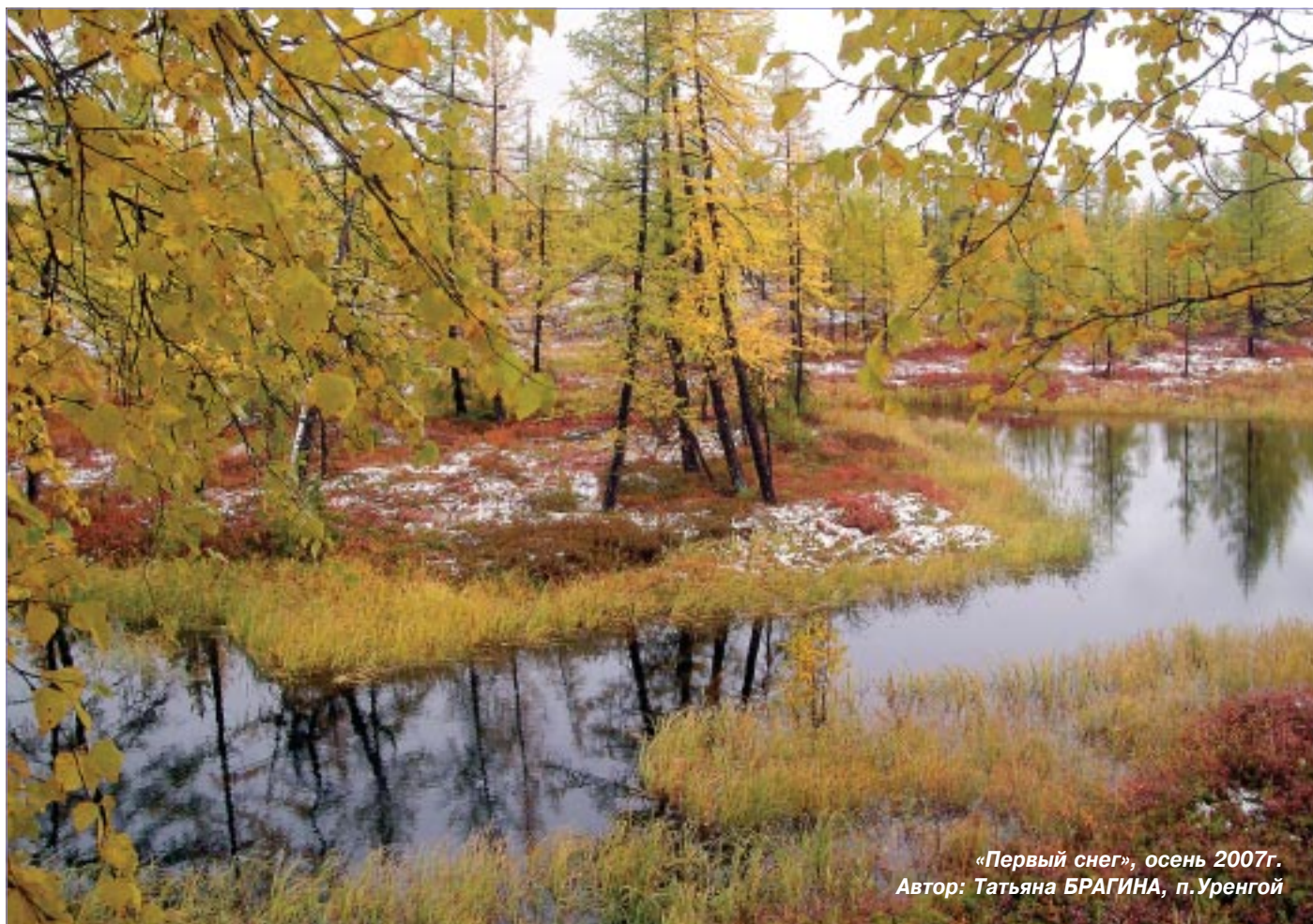
«Первый снег», осень 2007г.