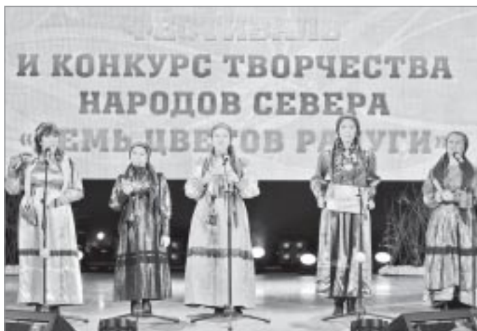
Вокальный ансамбль «Самбургские зыряночки»