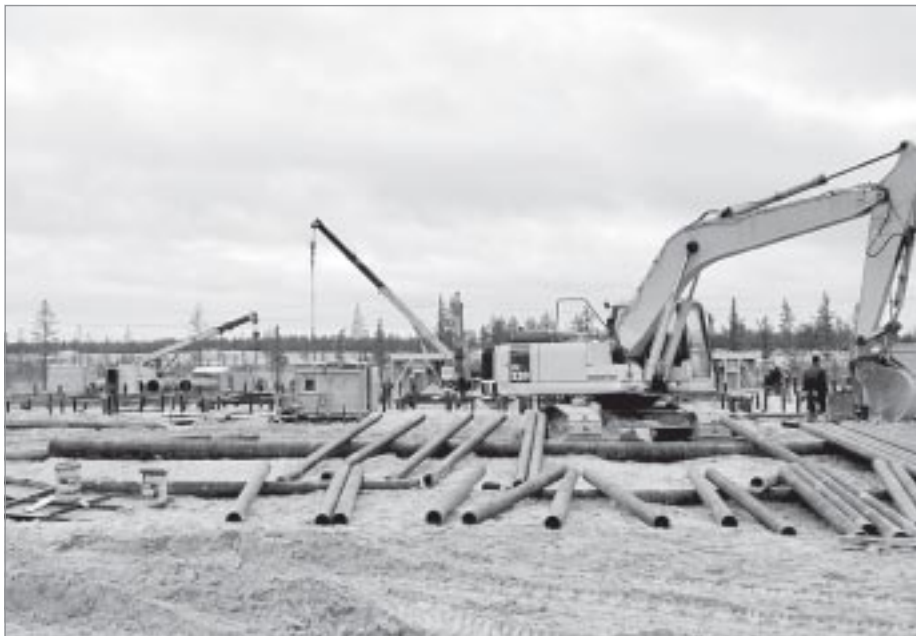
Строительство третьей очереди ДКС (сентябрь 2013 года)

В перспективе - в 2013-2014 годах - планируется масштабное увеличение парка дожимных компрессорных станций. Так, на октябрь намечен ввод в эксплуатацию второй очереди ДКС цеха добычи газа и газового конденсата Ханчейского месторождения. В будущем году запланирован ввод в эксплуатацию третьей очереди ДКС в цехе добычи газа и газового конденсата. В рамках мероприятий по разработке южной части нефтяной залежи Восточно-Таркосалинского месторождения начнет-