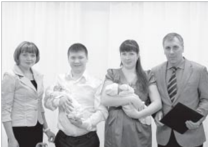
Автор: Татьяна ВОЛКОВА, библиотека семейного чтения г.Тарко-Сале

РАДОСТЬ. КАК ЧАСТО МЫ ИСПЫТЫВАЕМ ЭТО ЧУВСТВО? СЧИТАТЬ ВРЯД ЛИ КТО ВОЗЬМЕТСЯ, НО ОНО ПРИСУТСТВУЕТ В НАШЕЙ ЖИЗНИ НЕЗАВИСИМО ОТ ПОГОДЫ, ВРЕМЕНИ ГОДА ЭКОНОМИЧЕСКИХ ПОКАЗАТЕЛЕЙ. НЕ БУДЬ СЧАСТЛИВЫХ МОМЕНТОВ, НАШЕ ПРЕБЫВАНИЕ НА ЗЕМЛЕ БЫЛО БЫ ЛИШЕНО ТЕХ ЯРКИХ КРАСОК, КОТОРЫЕ СОГРЕВАЮТ ДУШУ. КАК МНОГО ПОВОДОВ ДЛЯ ВОСТОРГА! РОЖДЕНИЕ РЕБЕНКА, ПОКУПКА МАШИНЫ, ПЕРВЫЙ РАЗ - В ПЕРВЫЙ КЛАСС, ДА И ПРОСТО ПОБРОДИТЬ ПО ОСЕННЕМУ ЛЕСУ - ЭТО ТОЖЕ РАДОСТЬ. СЕГОДНЯ РЕЧЬ ПОЙДЕТ О ДВУХ ПРАЗДНИЧНЫХ СОБЫТИЯХ, КОТОРЫЕ ПРОИЗОШЛИ В ПУРПЕ В ОДИН ДЕНЬ - 27 СЕНТЯБРЯ.