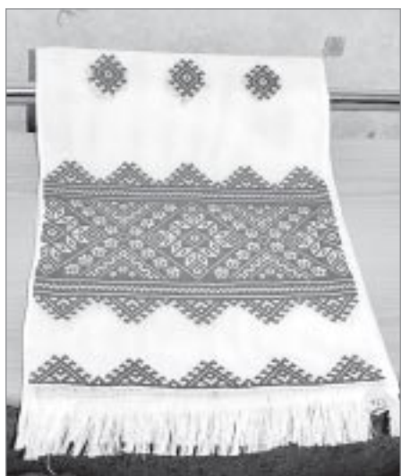
Украинский рушник вышит специально к свадьбе сына Павла