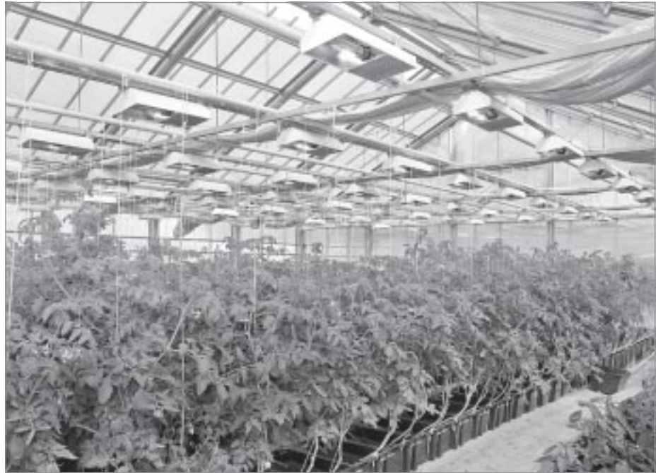
Скоро самбуржцы будут со свежими овощами

- Она сохранилась, но очень своеобразно. У них олени - это те же самые коровы, которые стоят в стойле, едят и доятся. Да, оленеводство можно сделать супер-эффективным. Но в нашей ситуации разведение оленей - не только отрасль экономики. Это возможность сохранения самобытной северной культуры. Да, мы говорим об изгородном содержании, но при этом не ломаем вековые устои. А при тех способах хозяйствования, которые применяются сегодня в скандинавских странах, ни о каком сохранении культурных традиций не может быть и речи. При всей безрадостной картине будущего я верю, что мы сумеем это богатое наследие сберечь. И, несмотря на отток населения из тундры, я вижу, что молодые люди все же возвращаются к своим корням. Пусть их немного, но они есть.