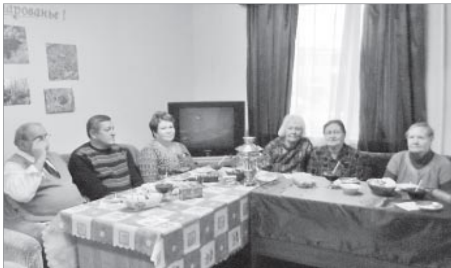
Самые активные читатели библиотеки семейного чтения

нашей стране. Ведь с детства мы впитываем от людей старшего поколения народные традиции и мудрость, основы культуры и родной речи. Из бабушкиных сказок, из рассказов деда рождается наша первая любовь к родной земле и ее жителям.