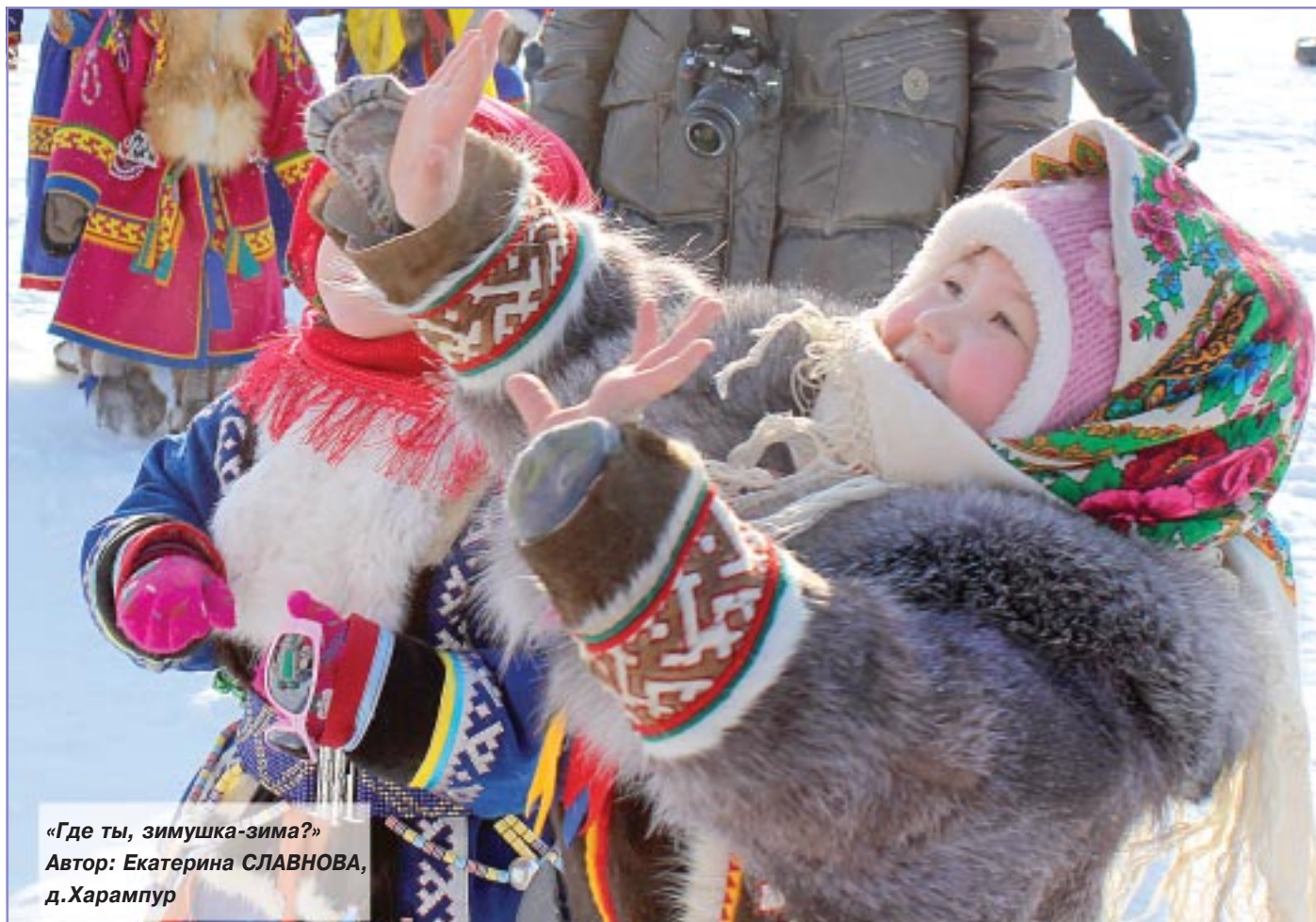
«Где ты, зимушка-зима?» Автор: Екатерина СЛАВНОВА, д.Харампур