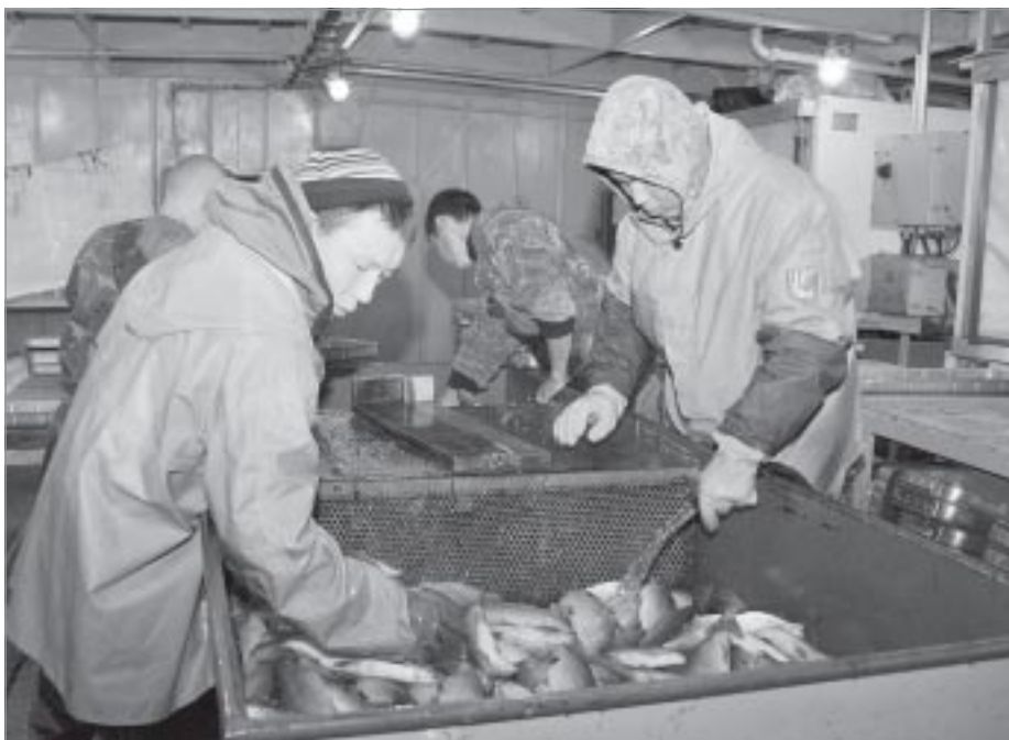
Без рыбы Пуровский район не останется

А теперь о качестве. Слухи недостоверны. Качество нашей пушнины не уступает ни одному производителю. И говорить так у меня есть полные основания. Помимо кормов, добавок, ветеринарного обслуживания, на что совхоз средств не