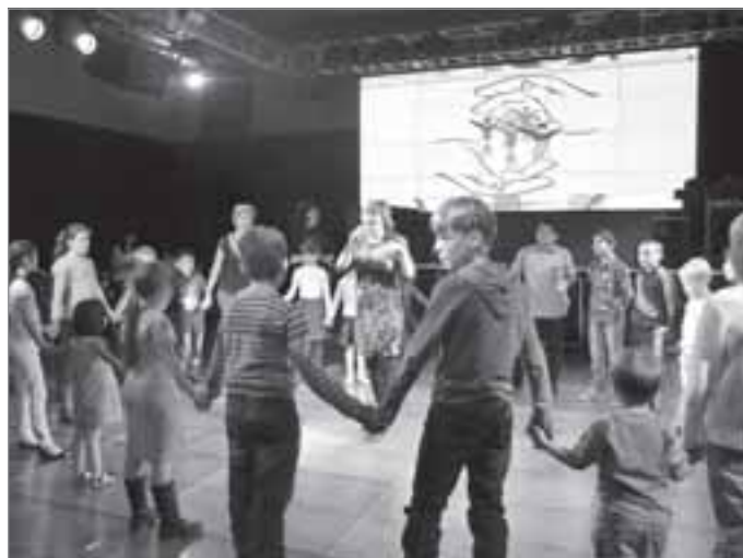
«Веселый выходной» в «Апельсине»

Выражаю огромную благодарность всем, кто уже отклик-