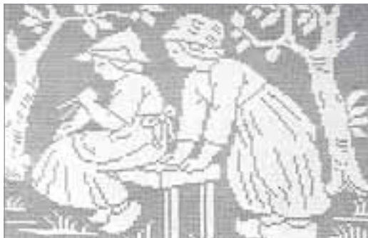
Одна из картин, вывязанных крючком

им и стараюсь принять справедливое решение.