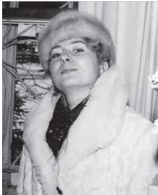
В старом здании суда, 1995 год

И вне зависимости от погодных условий и моего местонахо-