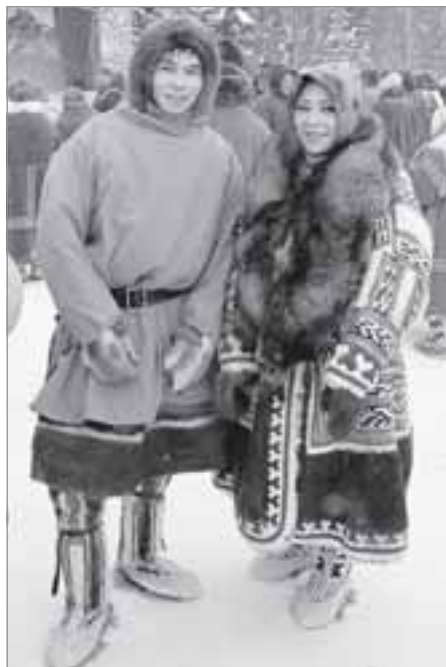
Было много красивой молодежи в яркой национальной одежде

Молодежь тоже не отстает, что называется, наступает на пятки профессионалам. Чего стоит управление оленьей упряжкой без хорея - а было на соревнованиях и такое. У двадцатичетырехлетнего