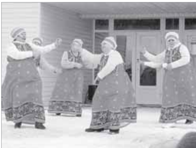
В этот день звучали народные песни

НАРОДНЫМИ ГУЛЯНИЯМИ ОТМЕТИЛИ В МИНУВШИЙ ВЫХОДНОЙ ВЕСЕЛУЮ МАСЛЕНИЦУ В ПОСЕЛКЕ УРЕНГОЕ.