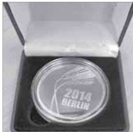
Заслуженная награда европейского агропрома

В этом году ООО «Пур-рыба» исполняется 10 лет. Много это или мало, зависит от личного отношения к происходящим событиям. Только одни жалуются на тяже-