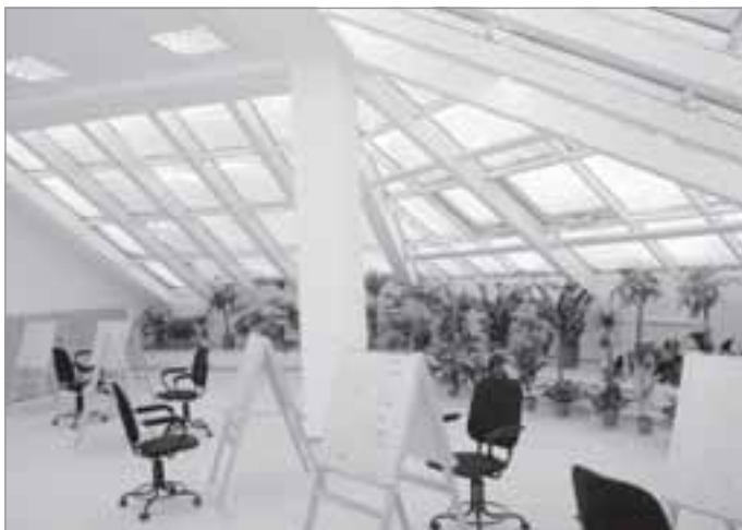
Изостудия в новом здании детской школы искусств

колаевич ознакомился с графиком работ и соблюдением требований к качеству строительства, проверил сметную документацию объекта. Корпус, сдача которого также запланирована в этом году, рассчитан на 425 детей, общая его площадь свыше 16,5 тысячи квадратных метров.