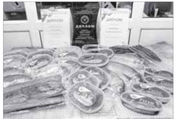
Ассортимент поражает воображение

К сожалению, предприятие пока не в состоянии поставлять товар на междуна-