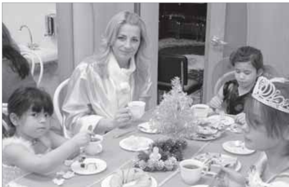
Новогодний сладкий стол в детском приюте «Луч надежды»