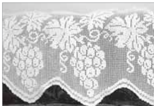
Занавеска в технике филейного вязания

Я счастливый человек. Говорю это абсолютно искренне, потому что всю жизнь занимаюсь тем, что люблю: у меня любимая работа и любимые увлечения. ■