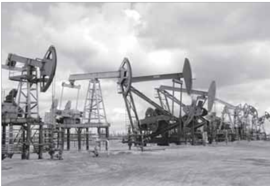
Объём добытой в районе нефти составляет 89,5% от нефтедобычи в ЯНАО

розничной торговли за 2013 год составил 5млрд. 670млн. рублей с темпом роста 109% к соответствующему периоду прошлого года.