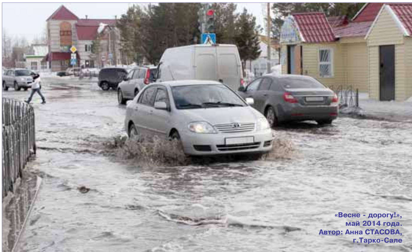
«Весне - дорогу!», май 2014 года.

Уважаемые читатели, ваши фотоработы ждем по адресу: gsl@prgsl.info .