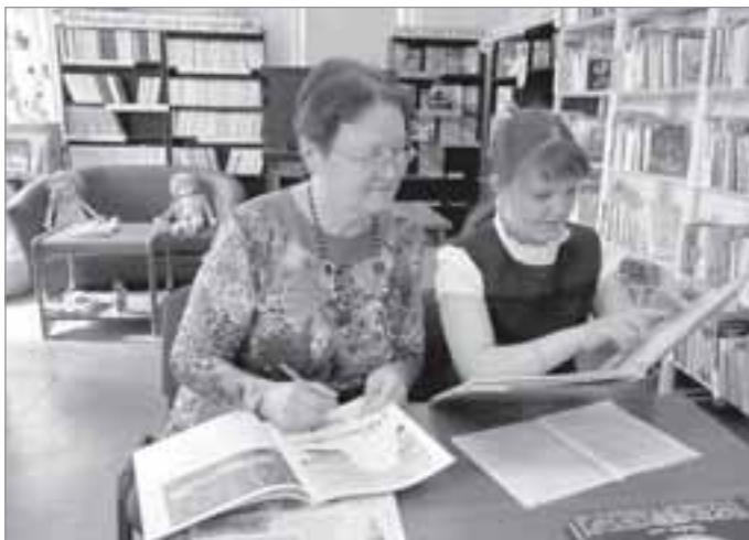
Библиотека объединяет читателей всех возрастов

С ЧЕМ ОБЫЧНО У НАС АССОЦИИРУЕТСЯ СЛОВО «БИБЛИОТЕКА»? КОНЕЧНО ЖЕ, С КНИГАМИ. А ЕЩЕ С ТИШИНОЙ. ИЛИ ТЕТЕНЬКОЙ, СКЛОНИВШЕЙСЯ НАД КЛУБКОМ СО СПИЦАМИ, КОТОРАЯ СИДИТ ЗА КАФЕДРОЙ И ВЫДАЕТ КНИЖКИ - ИМЕННО ТАК ДО СИХ ПОР ДУМАЮТ ОТДЕЛЬНЫЕ «НЕЧИТАТЕЛИ». НО ВСЕ ЭТО УЖЕ НЕ АКТУАЛЬНО.