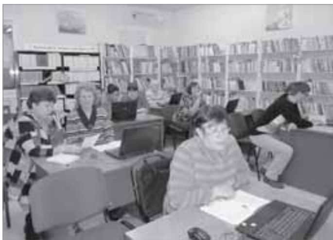
На курсах «С компьютером на ты»

В феврале нынешнего года мы пригласили наших коллег из библиотек Пуровского района к себе в гости. На семинаре «Внедрение информационных технологий в практику работы муниципальных библиотек» рассматривали проблему продвижения книги и чтения с помощью современных информационных технологий. На мастер-классе по созданию буктрейлеров участники самостоятельно попробовали создать собственные видеоролики. Надеемся, что программа Vegas покорится им тоже.