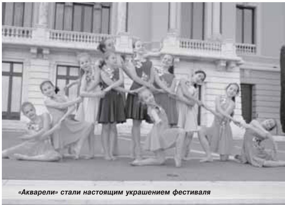
«Акварели» стали настоящим украшением фестиваля

В день награждения состоялся гала-концерт лучших коллективов фестиваля. «Акварели» были в их числе.