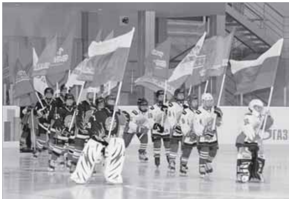
Важным событием 2013 года стало открытие спорткомплекса «Авангард»