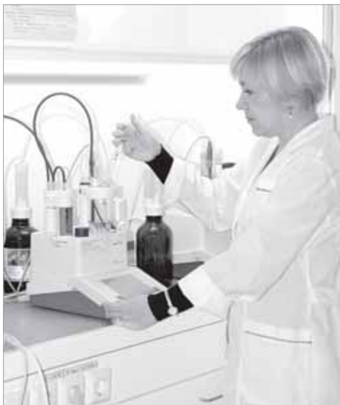
Лаборатория химического анализа ООО «НОВАТЭК-ЮРХАРОВНЕФТЕГАЗ» скоро отпразднует 14-летие