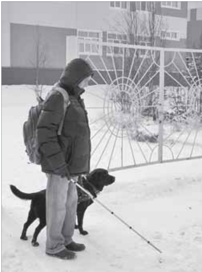
«Стоп, - собака предупреждает, - впереди дорога»

достойной встречи с Эльбой - с утра общалась лекция, а после обеда знакомство с инструктором.