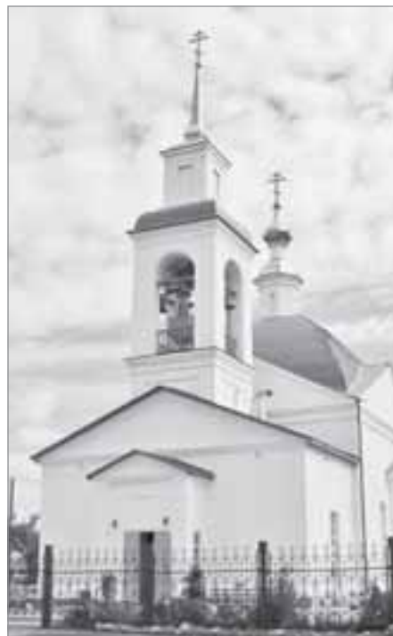
Церковь святых Петра и Павла

Пешком много не пройдешь, и, вернувшись в машину, мы решили объехать село кругом. Следуя дальше, совершенно неожиданно натываемся на сельский музей - Абатский краеведческий. Само здание 1855 года постройки, некогда бывший дом купца - уже достопримечательность. Целых восемь залов, наполненных историческими, краеведческими и даже археологическими экспонатами, думаю, смогут удивить любого посетителя. Так, например, представлены семнадцать видов доисторических животных, обитавших на