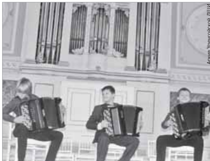
Архив Уренгойской ДШИ

После конкурса юные дарования приняли участие во Всероссийской фольклорной творческой школе, которая прошла на базе детского лагеря «Зеркальный». В течение десяти интересных и плодотворных дней дети из разных регионов страны творили вместе, объединяясь в большие и малые ансамбли, общались с ведущими педагогами и музыкальными деятелями.