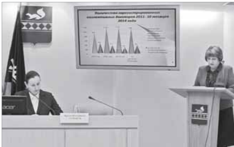
Отдел организации и охраны труда управления экономики администрации района