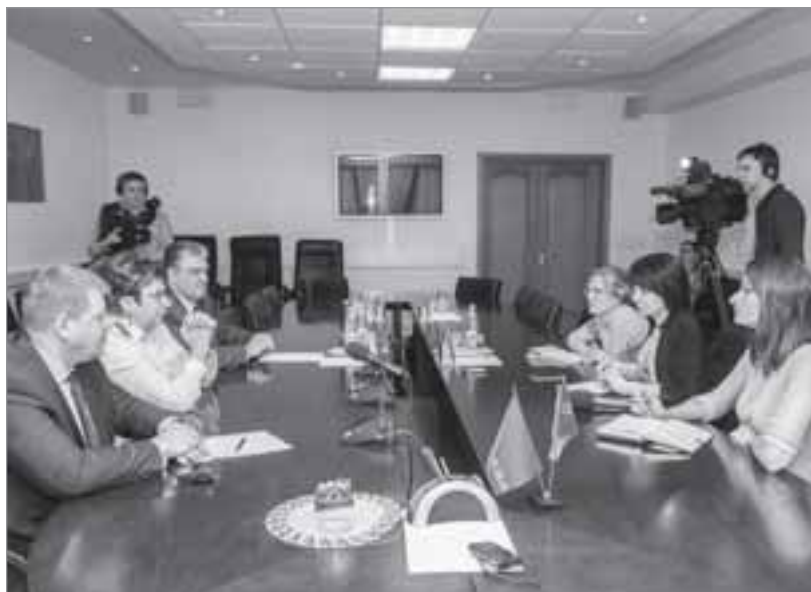
Руководители Роспотребнадзора ответили на вопросы СМИ

В беседе с журналистами представители Роспотребнадзора призвали родителей серьезней относиться к здоровью своих детей и посетовали на то, что зачастую отказ родителей от вакцинации детей является недоработкой медицинских работников, не предоставляющих необходимую информацию о заболевании, его осложнениях, о средствах