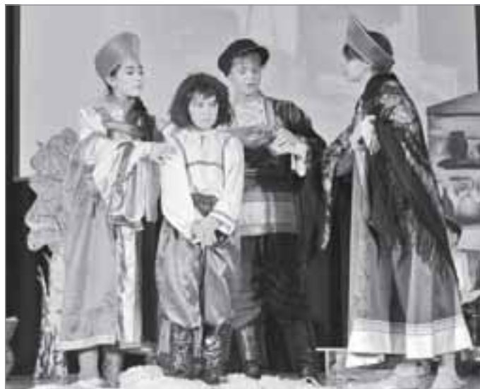
Конкурс устного народного творчества. Сказка от уренгойского коллектива «Шкатулка»