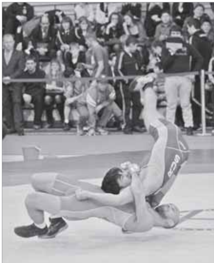
С изменением правил греко-римская борьба стала более зрелищной и динамичной

Как всегда, были среди участников и недовольные судьейством. «Какие четыре очка? Максимум два!» - негодовал один из именитых тренеров. В такие моменты