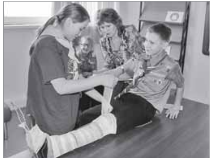
Обучение оказанию первой медицинской помощи

Очень результативным стал и проведенный опрос в виде тестирования. Участни-