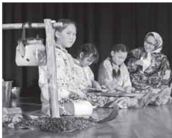
На сцене - ненецкий сказ «Морошкины именины»

Север, как и Ямал - неотъемлемая его часть, - край многонациональный, восхищающий не только своим великолепием и самобытностью, но и своеобразием культур живущих здесь людей. Окунувшись в атмосферу фестиваля искусства, мы побывали в ненецком чуме на «Морошкиных именинах», на молдавских крес-