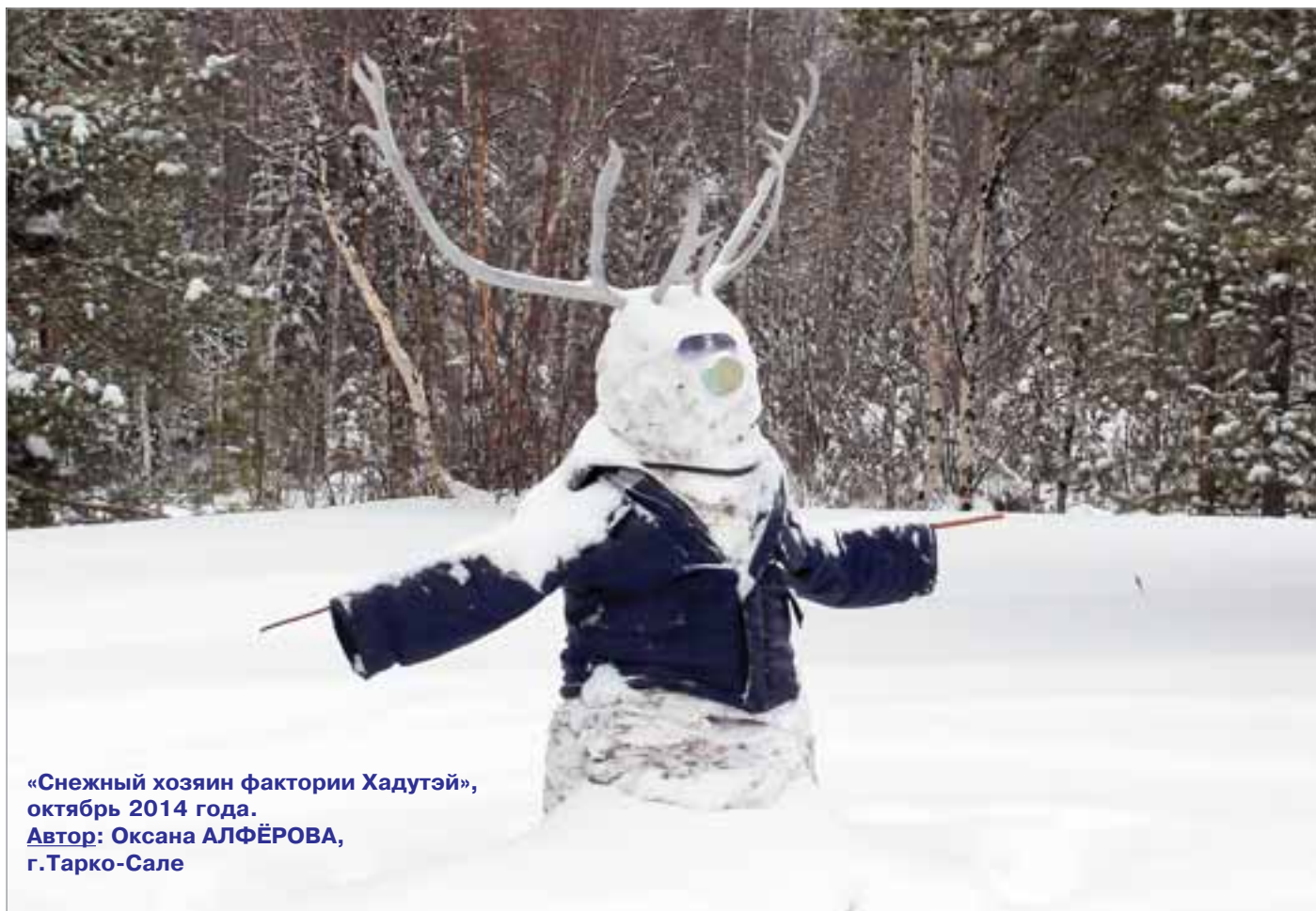
«Снежный хозяин фактории Хадутэй», октябрь 2014 года.