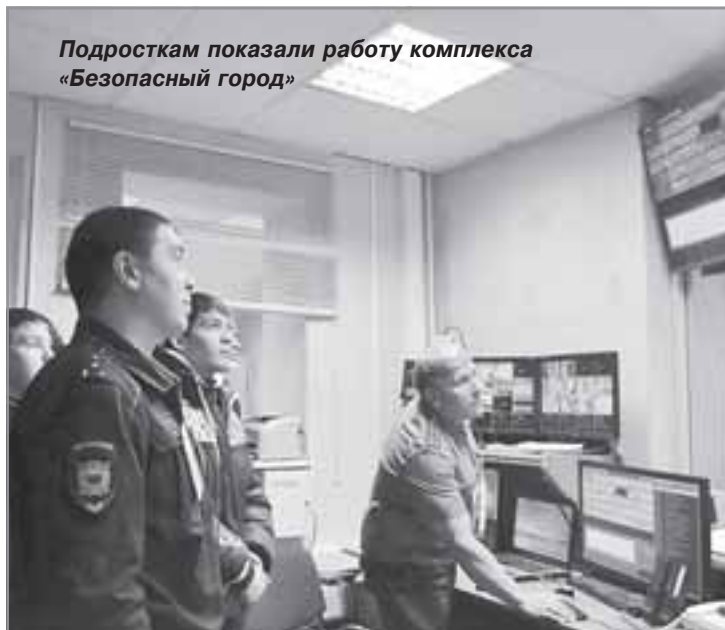
Подросткам показали работу комплекса «Безопасный город»

НАКАНУНЕ ДНЯ РОССИЙСКОГО СТУДЕНЧЕСТВА УЧАЩИЕСЯ ПРОФЕССИОНАЛЬНОГО УЧИЛИЩА ГОРОДА ТАРКО-САЛЕ И ШКОЛЫ-ИНТЕРНАТА РАЙОННОГО ЦЕНТРА ПОСЕТИЛИ ОТДЕЛ МВД РОССИИ ПО ПУРОВСКОМУ РАЙОНУ. ДЛЯ НИХ БЫЛА ОРГАНИЗОВАНА ВСТРЕЧА С СОТРУДНИКАМИ НЕСКОЛЬКИХ ПРОФИЛЬНЫХ СЛУЖБ, КОТОРЫЕ ПОДРОБНО РАССКАЗАЛИ О СВОИХ ПОДРАЗДЕЛЕНИЯХ, О СПЕЦИФИКЕ ПРОФЕССИИ ПОЛИЦЕЙСКОГО.