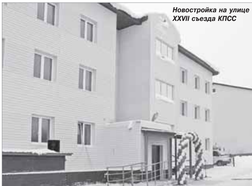
Новостройка на улице XXVII съезда КПСС