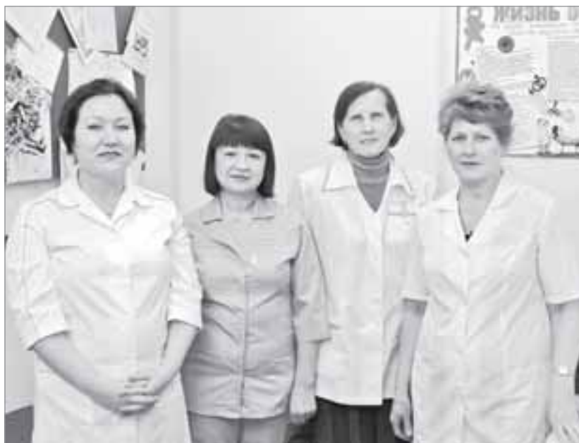
Коллектив Таркосалинского отделения переливания крови

Открытие кабинета переливания крови в 1999 году стало значимым событием в сфере здравоохранения Пуровского района. В центральной части России в те годы службы переливания крови уже давно функционировали и развивались, используя в работе самые современные технологии. Наш район в этом смысле был отстающим.