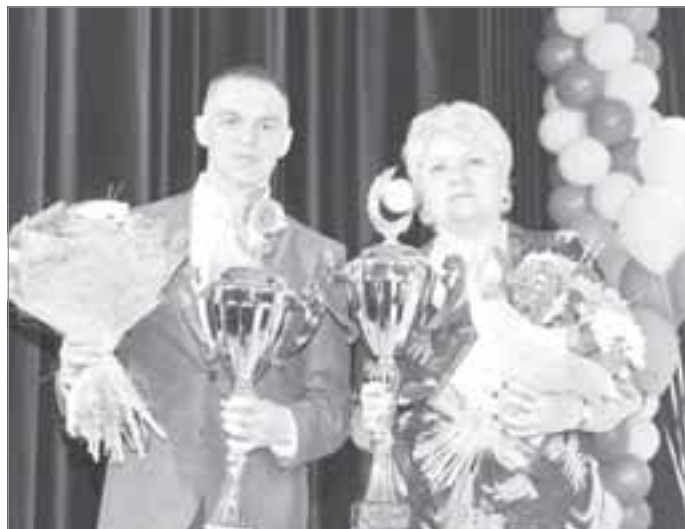
Победители спартакиады среди трудовых коллективов и зональной спартакиады учащихся