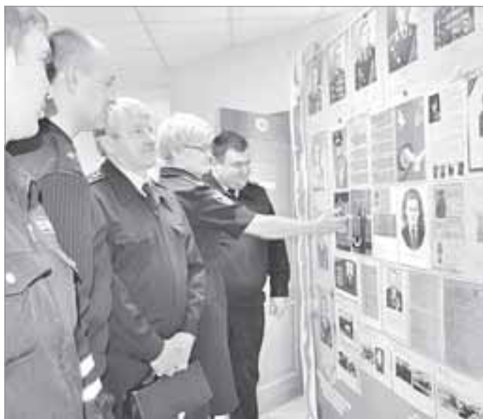
Сотрудники районного отдела полиции проявляют неподдельный интерес к материалам об участии родственников в Великой Отечественной войне

НАКАНУНЕ ДНЯ ПОБЕДЫ ПО ИНИЦИАТИВЕ ПРЕДСЕДАТЕЛЯ ОБЩЕСТВЕННОЙ ОРГАНИЗАЦИИ «ВЕТЕРАНЫ ОТДЕЛА ВНУТРЕННИХ ДЕЛ ПО ПУРОВСКОМУ РАЙОНУ» И ОТДЕЛА ПО РАБОТЕ С ЛИЧНЫМ СОСТАВОМ В РАЙОННОМ ОТДЕЛЕ ПОЛИЦИИ ПРОШЛА ПАТРИОТИЧЕСКАЯ АКЦИЯ «КОГДА ПАМЯТЬ СИЛЬНЕЕ ВРЕМЕНИ».