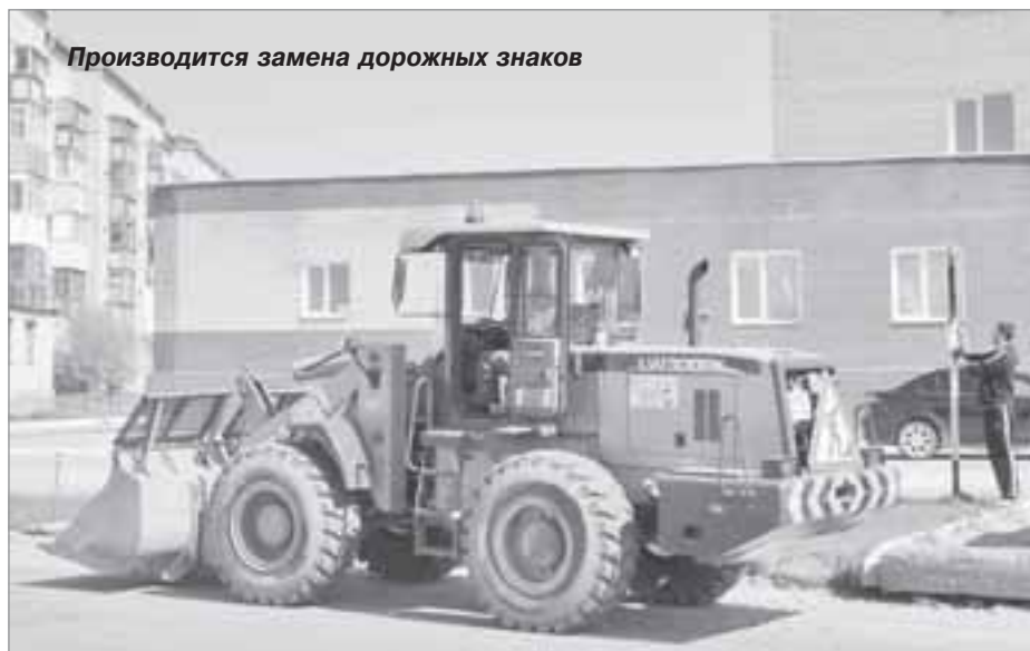
Производится замена дорожных знаков

- Летом продолжим снос расселенного ветхого жилья. В прошлом году было снесено 11 отживших свой срок многоквартирных домов. В этом