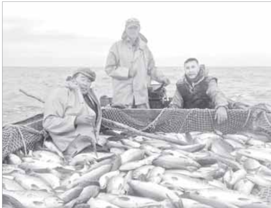
За два месяца путины каждый рыбак-общинник зарабатывает до 200 тысяч рублей

Я специально интересовалась результатами работы в путину 2014 года у председателя совета родовых хозяйств и общин. Тогда на рыбалке толь-