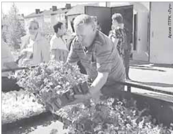
Архив ПТРК «Луч»

На прошлой неделе в поселок привезли рассаду цветочных культур. Более девяти тысяч растений 20 сортов будут теперь радовать жителей и гостей Ханымея.