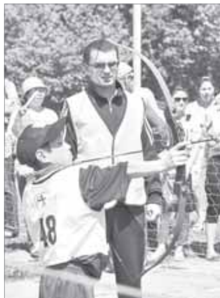
Каждый коренной сахалинец мастерски владеет луком

Пора сертифицировать свою продукцию, оформлять должным образом необходимые документы, защищать свое авторское право. Не трудиться на чужого дядю, а зарабатывать для себя, для развития собственного бизнеса. Первый этап, когда сахалинские руко-