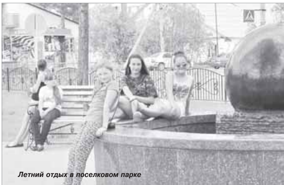
Летний отдых в поселковом парке

- На летнем отдыхе детей в Пуровском районе никогда не экономи-