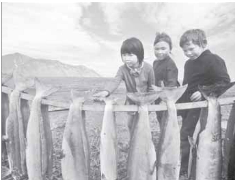
Рыба, дикоросы и морепродукты - основа пищевого рациона населения области

дельники доводили до товарного вида свои поделки, учились использовать упаковочные материалы, реализовывали пробные партии, уже прошел. Сейчас это вчерашний день. Жизнь заставляет идти дальше - теперь уже на рынок сбыта. Понятно, что только за счет средств, вырученных от прода-