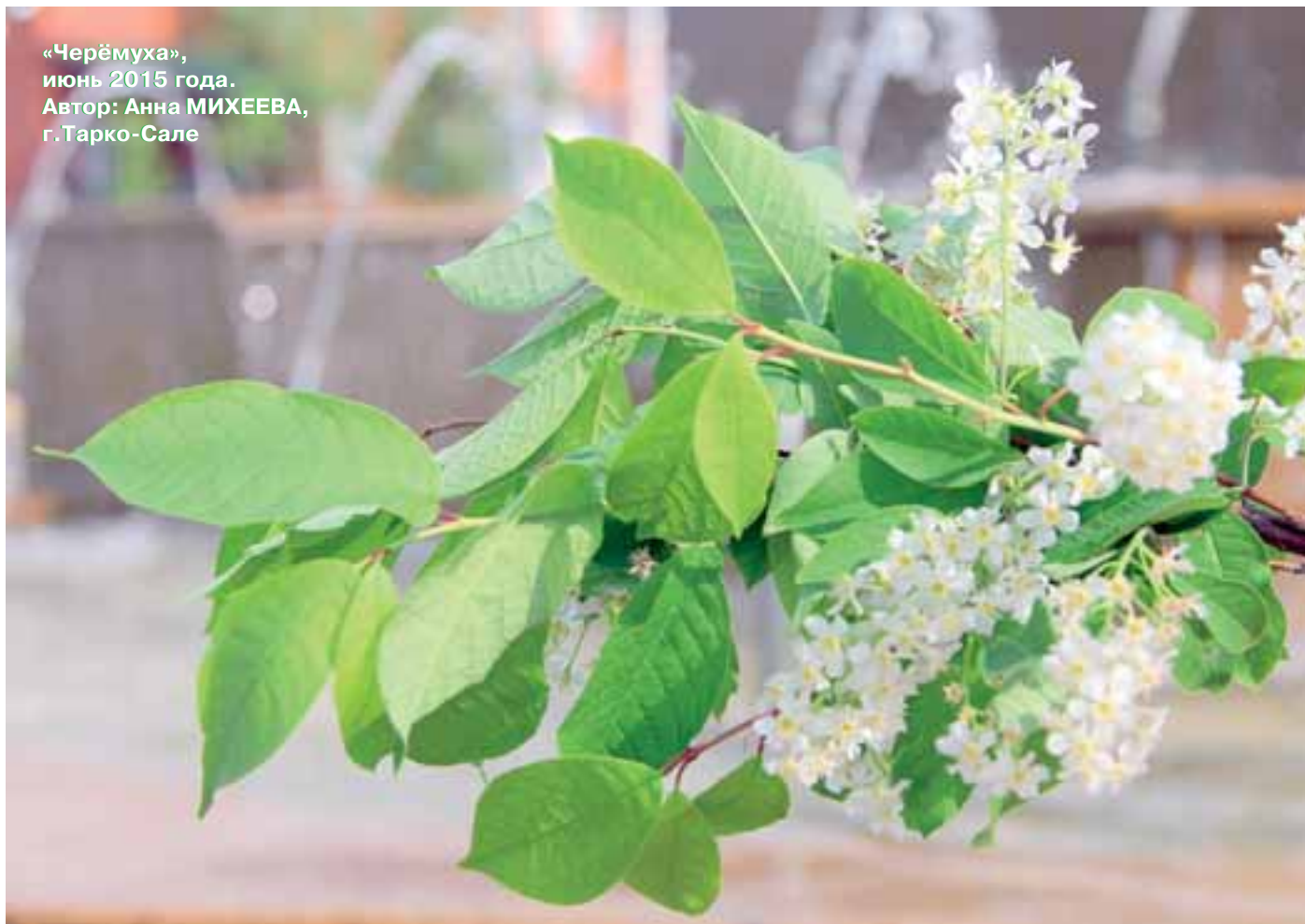
«Черёмуха», июнь 2015 года.