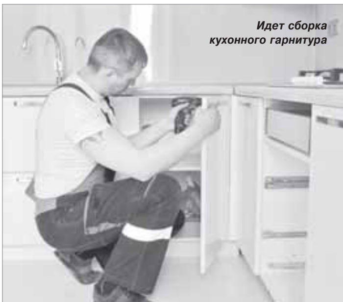
Идет сборка кухонного гарнитура

Имея многолетний опыт работы в своей области, он часто сталкивается с тем, что недобросовестные изготовители присылают заказчику детали без отверстий и разметок. В этом случае сборщику приходится самому все просчитывать, замерять и высверливать. Иногда из-за отсутствия опыта клиент может перепутать стенки, дверцы и так далее. И как резуль-