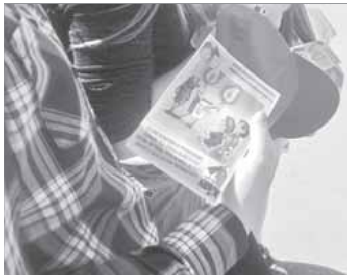
Каждый ребенок получил памятку

Первого июня, в День защиты детей на площади культурно-спортивного комплекса «Геолог» прошло массовое гуляние, где собралось около 150 детей. Здесь же побывали и сотрудники пожарной охраны, принимая активное участие в празднике. Они привлекли внимание детей к повторению в игровой форме правил пожарной безопас-