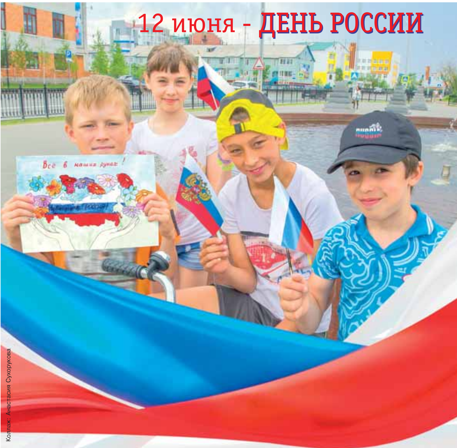
Коллаж: Анастасия Сухорукова