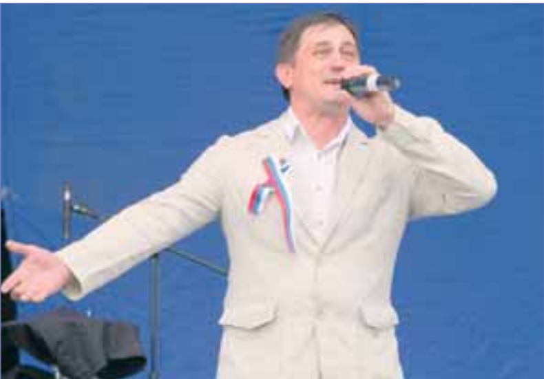
Автор: Галина ПОКЛОНСКАЯ