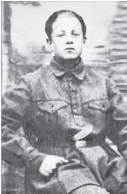
На курсах буровых мастеров, г. Киев, 1930 год

пугали тюрьмой, но, смилостивившись, всего лишь убрали с должности инструктора и назначили заведующим кассой. Но, как только потребовались его знания и опыт руководящей работы, случилось это накануне войны, тут же вызвали обратно».)