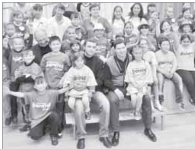
В гостях на пришкольной площадке