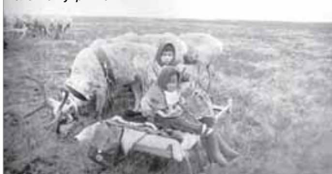
Все женщины-тундровички умеют управлять оленьей упряжкой