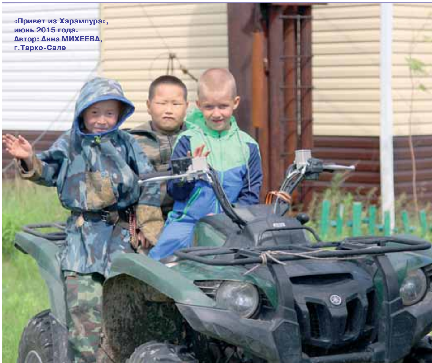
«Привет из Харампура», июнь 2015 года. Автор: Анна МИХЕЕВА, г. Тарко-Сале