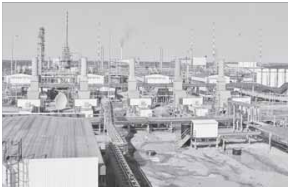
Термокарстовое месторождение. 2015 год

- В настоящий момент многие скептики утверждают, что строить экономику страны на добывающей отрасли - это тупиковый путь развития и углеводородные ресурсы скоро закончатся. Хотелось бы обратиться как к недропользователю: