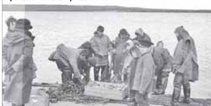
Выборка рыбы из сетей в деревянные ящики - финальный этап рыбалки

Первый сельский Совет был кочевым. Его задачей было проведение разъяснительной работы среди индивидуальных хозяйств ненцев. Сябали к тому времени овладел русским языком, довольно сносно разговаривал с русскими людьми, хорошо понимал устную речь. Старался читать и самостоятельно писать официальные бумаги.