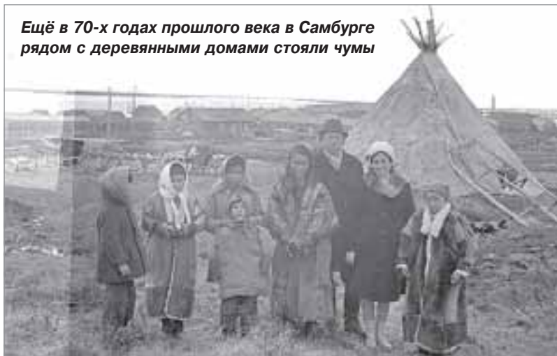
Ещё в 70-х годах прошлого века в Самбурге рядом с деревянными домами стояли чумы