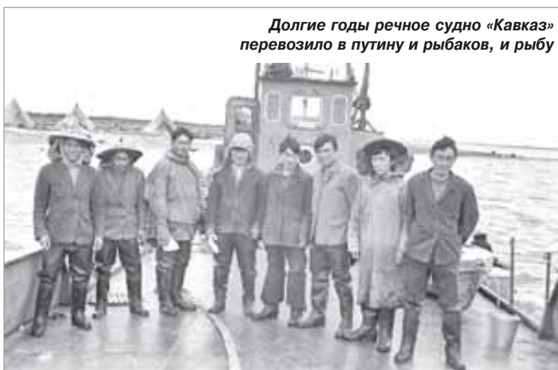
Долгие годы речное судно «Кавказ» перевозило в пугину и рыбаков, и рыбу

Вот и глава рода старик Салиндер размышляет про себя, не позвать ли шамана. А что? Пусть он покамлает, а высшие силы поведают ему про то, что видят и знают. О том, что происходит сегодня на земле и под землей. Пусть мудрый шаман скажет, зачем на берегу Пура русские люди стали из деревьев жилища возводить? Что ждать кочевникам от этих чужаков? Что такое колхозы, о которых пугающая молва по тундре летит? Пусть подскажут боги шама-