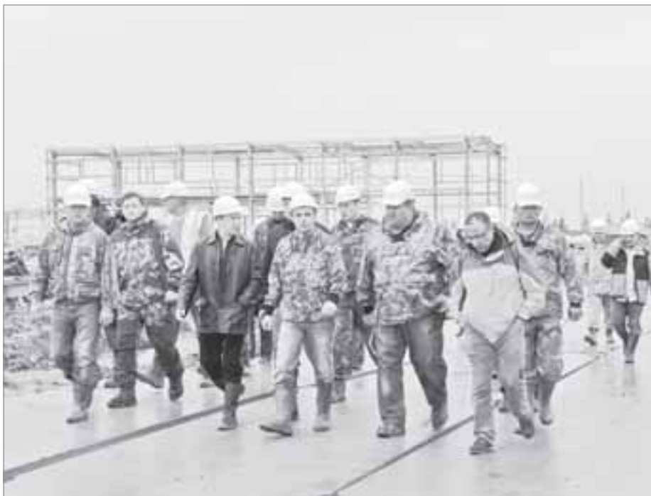
Производственники: люди не слова, но дела

мался оценкой и проектированием этого объекта. Эту работу считаю крайне важной, ведь от бесперебойной поставки газа зависит не только возможность пользования им каждым отдельным таркосалинцем в своей квартире, но и работа объектов жизнеобеспечения, в первую очередь, котельных. Таким образом, мы обеспечиваем энергобезопасность города, что в наших суровых арктических климатических условиях жизненно необходимо.