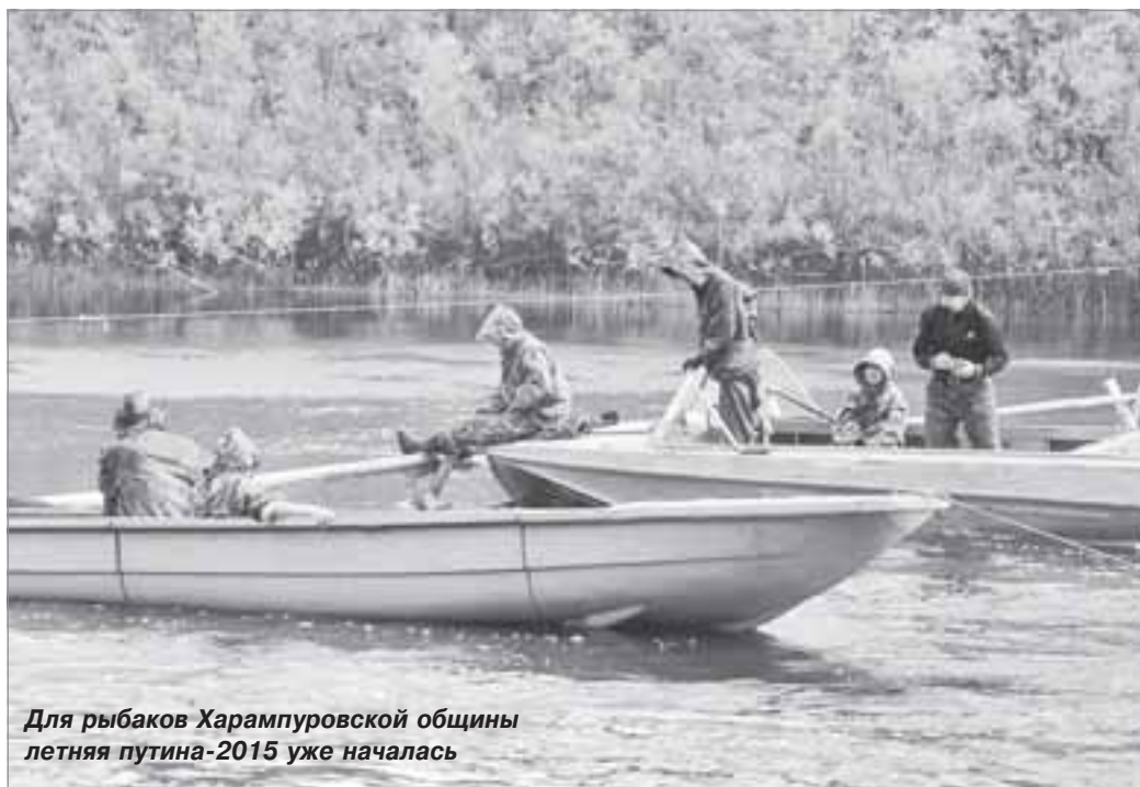
Для рыбаков Харампуровской общины летняя путина-2015 уже началась