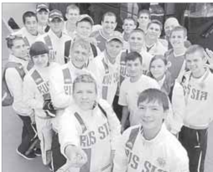
Быть частью юношеской сборной России по гиревому спорту - и почетно, и ответственно

И сейчас уже можно говорить, что гиревой спорт в Пурпе вышел на определенный уровень. В этом году на базе «Зенита» были проведены первые «взрослые» окружные соревнова-