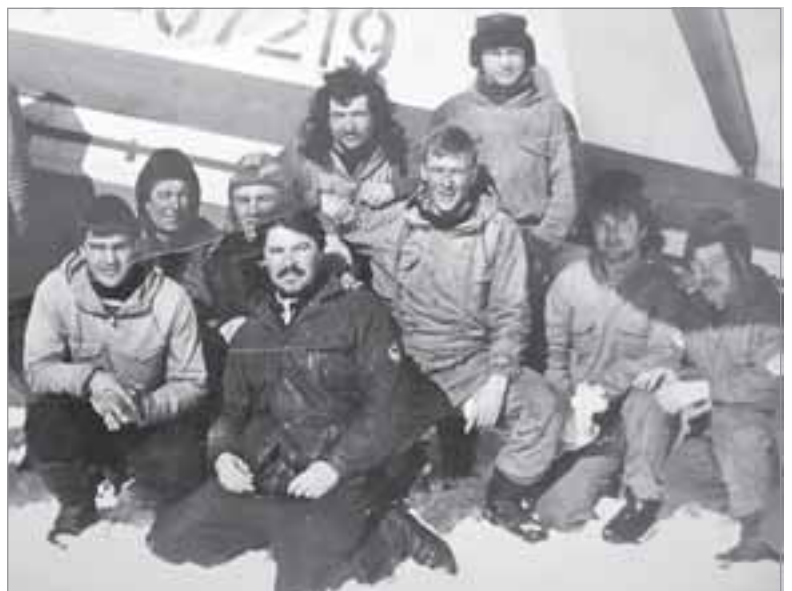
Коллектив геофизической партии №50, 80-е годы

После нескольких лет работы в СГПП, 1 января 1981 года Базеля перевели на должность старшего ин-