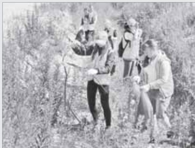
Макушка лета. Уборка продолжается...

- Помогала прошлым летом своей подруге, она была в трудовой бригаде, а я просто приходила и уби-