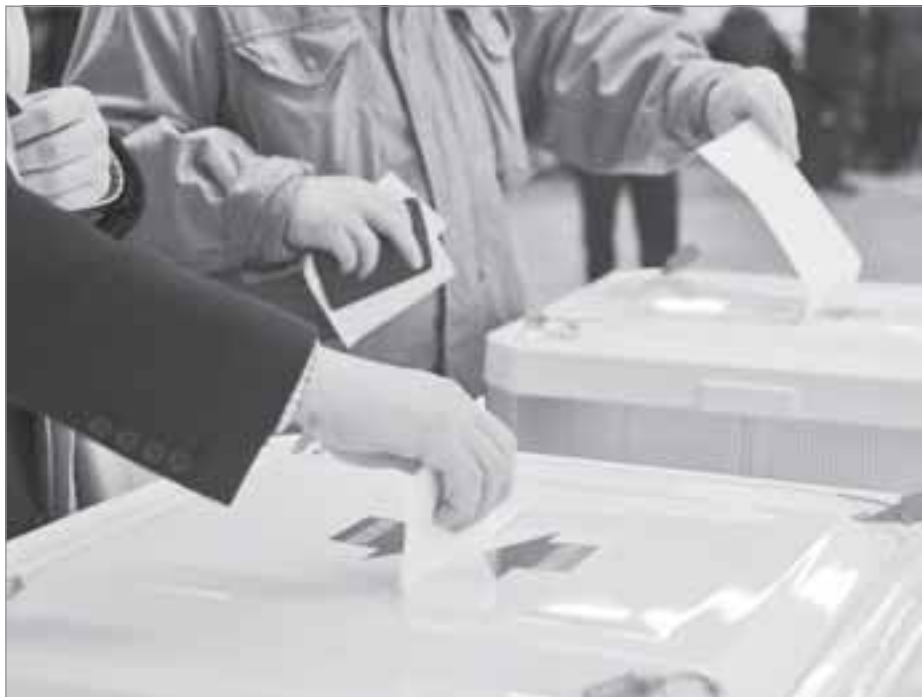
Автор: Руслан АБДУЛЛИН

Стоит отметить еще одно новшество. Партийные списки теперь будут делиться на два подсписка: общерегиональный, в который могут входить