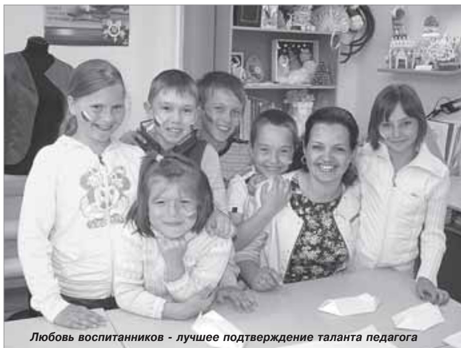
Любовь воспитанников - лучшее подтверждение таланта педагога