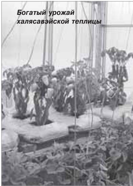
Богатый урожай халясавэйской теплицы