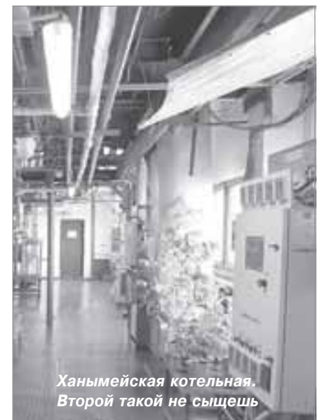
Ханымейская котельная. Второй такой не сыщешь

Также гости поселка отметили проделанную работу по благоустройству муниципального образования.