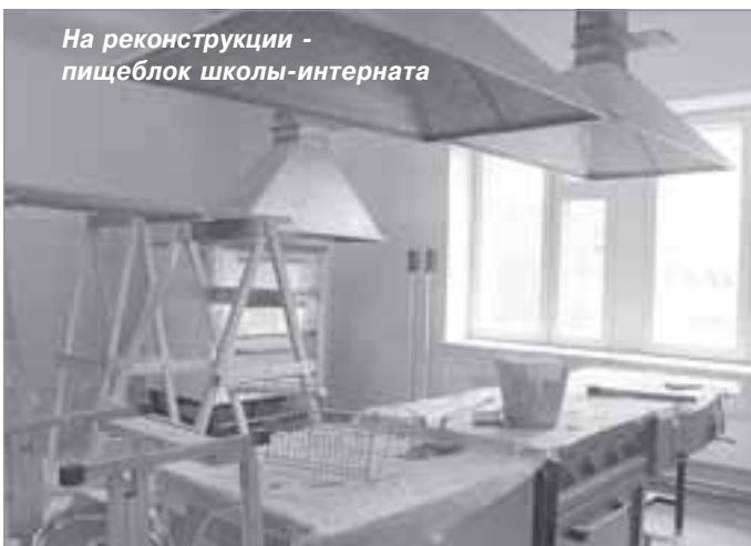
На реконструкции - пищеблок школы-интерната

Во время совещания, прошедшего в администрации поселка по итогам ознакомления с работами на объектах, Евгений Владимирович отметил, что в целом увиденным доволен: все, что было запланировано - идет по графику. Особое внимание глава района уделил ремонту в школе-интернат: