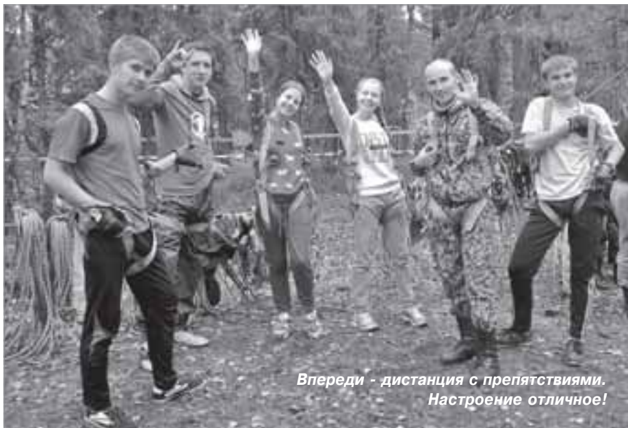
Впереди - дистанция с препятствиями. Настроение отличное!

По итогам взрослого слета «Серебряный карабин» на контрольно-туристском маршруте первыми стали