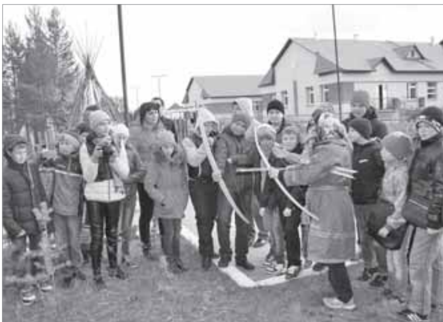
Текст и фото: Светлана ПИНСКАЯ

Общение, смех, поедание припасенных вкусностей, созерцание осенней безмятежности и полуторачасовой