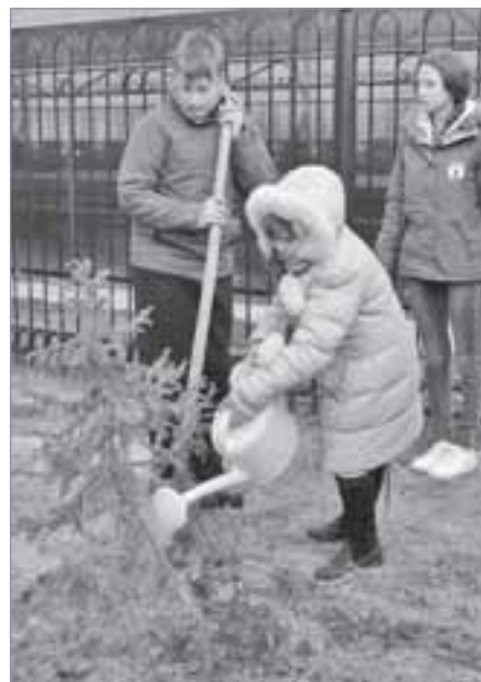
Маленький, но важный вклад в Аллею Победы

У входа в аллею был установлен памятный знак в честь тех, кто отдал свою жизнь за Победу. Право его открытия предоставили кадетам класса оборонно-спортивного профиля таркосалинской второй школы. Один взмах, и огненно красное полотно всколыхнувшись на ветру, открыло памятную надпись: «Аллея заложена в честь 70-летия Победы в Великой Отечественной войне». Аплодисменты