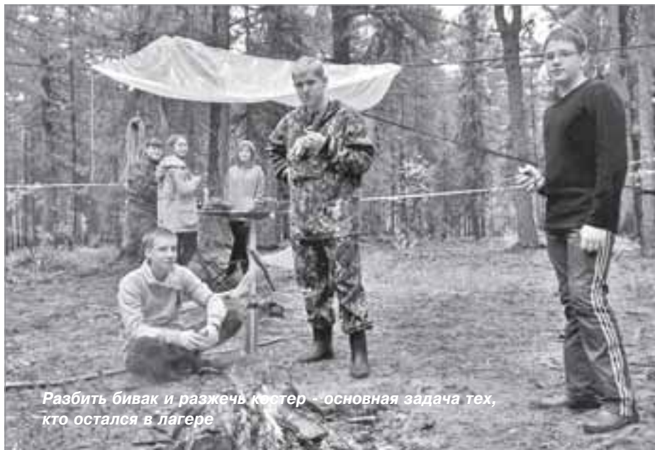
Разбить бивак и разжечь костер - основная задача тех, кто остался в лагере

манда «Привала.net» из поселка Пуровска.