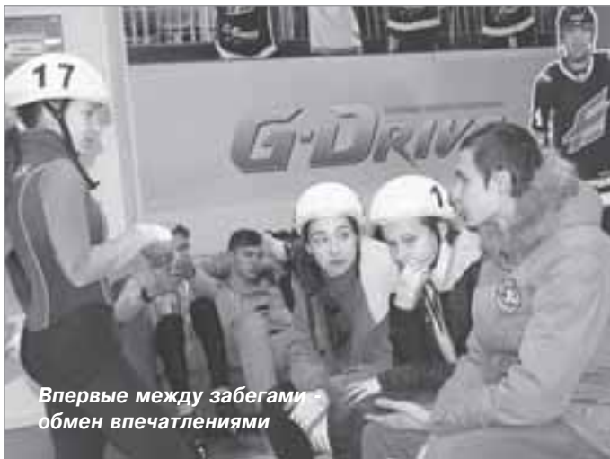
Впервые между забегами обмен впечатлениями

легии, а также согласно индивидуальным графикам, составленным ранее, официальные тренировки шорт-трекистов на ледовой арене. Каждый спортсмен получил возможность использовать свое личное время с пользой, не отвлекаясь на соперников. Закончился тренировочный день совещанием представителей команд и жеребьевкой.