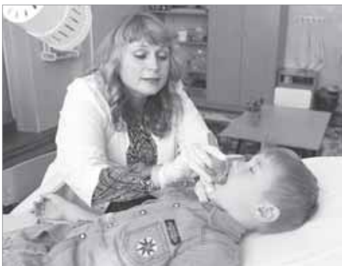
Тренировка языка - обязательная часть лечения малышей с нарушениями речи

С КАЖДЫМ ГОДОМ ДЕТЕЙ ДОШКОЛЬНОГО ВОЗРАСТА, У КОТОРЫХ ИМЕЮТСЯ ТЯЖЕЛЫЕ НАРУШЕНИЯ РЕЧЕВОГО АППАРАТА, СТАНОВИТСЯ ВСЕ БОЛЬШЕ. ТАКИМ ДЕТЯМ ОСТРО ТРЕБУЕТСЯ ПРОФЕССИОНАЛЬНАЯ ПОМОЩЬ ЛОГОПЕДОВ.