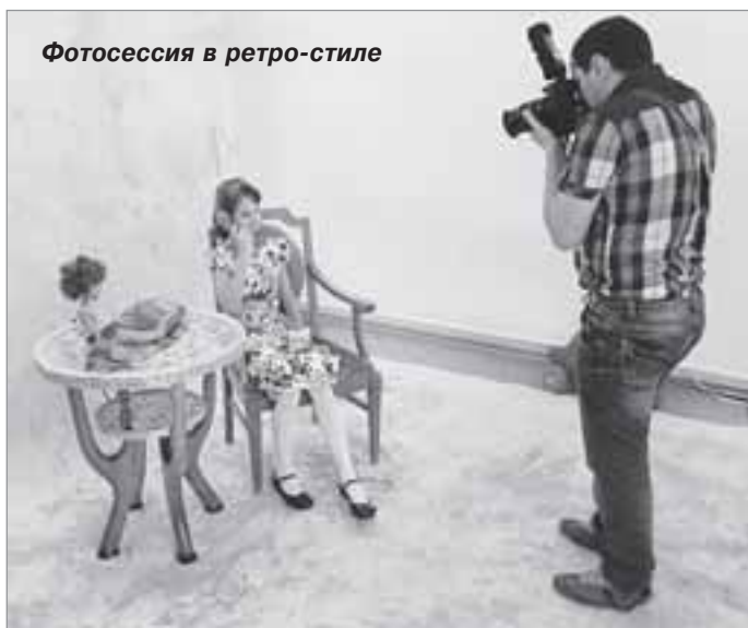
Фотосессия в ретро-стиле

Сотрудники историко-краеведческого музея подготовили для посетителей мастер-класс по графике - все желающие могли попробовать себя в технике рисования гелиевыми ручками. Те, кого больше привлекает прикладное творчество, приняли участие в изготовлении золотой рыбки из подручных материалов. Кроме этого для ханымейцев, которые увлекаются музыкой и поэзией, организовали творческий вечер.