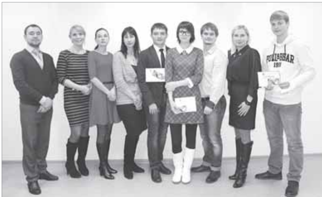
Текст и фото: Мария ШРЕЙДЕР