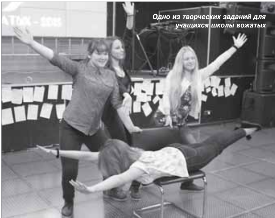
Одно из творческих заданий для учащихся школы вожатых

Текст и фото: Мариана ШИБАКОВА, методист МАУ «Районный молодежный центр»