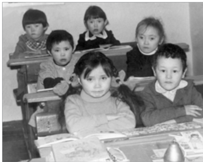
Воспитанники школы-интерната с.Самбург, 1988г.

В 2000, 2005, 2010 годах избирался депутатом законодательного (представительного) органа государственной власти ЯНАО. Работал председателем Комитета по делам национальностей, заместителем председателя Комитета Государственной Думы автономного округа по социальной политике, возглавлял Комитет по информационной политике, общественным объединениям и делам национальностей. В настоящее время член консультативного Совета финно-угорских народов мира, член правления окружной Ассоциации «Ямал - потомкам!». Награжден медалью ордена «За заслуги перед Отечеством» II степени, в 2006 году его имя занесено в книгу «Лучшие люди России».