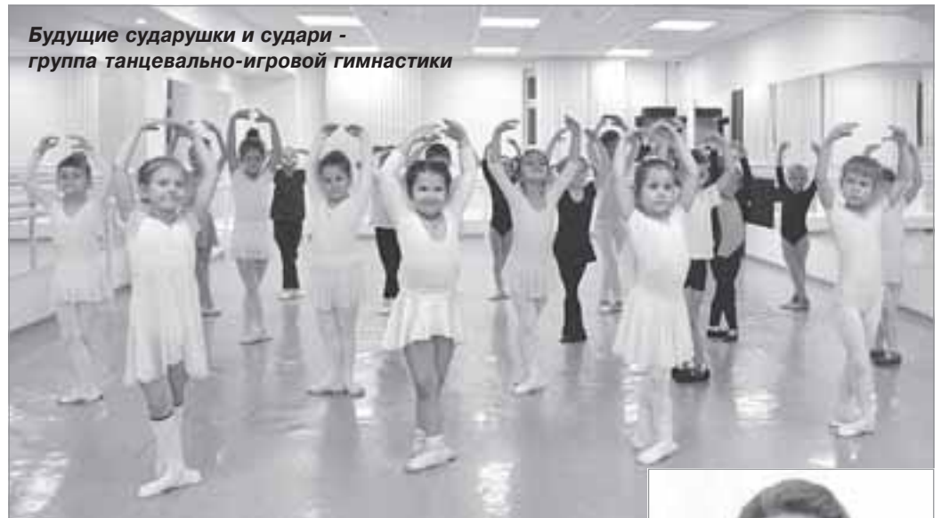
Будущие сударушки и судари - группа танцевально-игровой гимнастики

- На конкурс мы представили четыре хореографических произведения: «Ритмы Ямала», «Русская плясовая», «Барыня» и «Северный хоровод». «Ритмы Ямала» - яркий и самобытный танец, передает дух нашей малой родины. «Русская плясовая» - зажигательная, задорная, веселая, заводит зал. «Барыня» и «Северный хоровод» - визитные карточки ансамбля, отшлифованы на