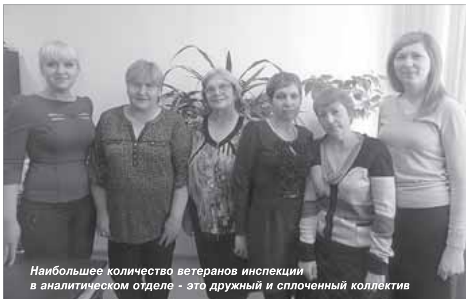
Наибольшее количество ветеранов инспекции в аналитическом отделе - это дружный и сплоченный коллектив

С уважением, глава Пуровского района Евгений СКРЯБИН