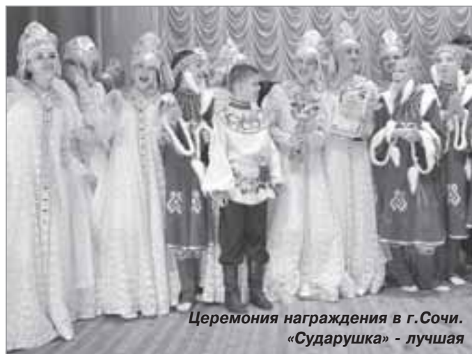
Церемония награждения в г.Сочи. «Сударушка» - лучшая

- Сложность народной хореографии заключается в том, что мастерство нарабатывается годами. Чем раньше ребенок начнет заниматься, тем больших успехов он сможет достичь. Исконная народная культура для современной молодежи совершенно незнакомое понятие, а поэтому приобщение к ней - дело длительное и кропотливое. Чтобы ребенок овладел всеми тонкостями народного танца, понимал, что он танцует и как, для этого нужны годы работы с педагогом. Иное дело - современный танец. Он привлекательней, актуальней, если можно так выразиться. Не каждый сегодня хочет стучать каблучками, изображая барыню. Уверена, что современных детей нужно влюблять в народную культуру, от которой они давно оторваны и которую не понимают. Ценность своей деятельности юные танцовщицы осознают на концертах, конкурсах, где публика открыто восхищается их выступлениями, потому что тем, чем занимается «Сударушка», сегодня занимаются единицы. Для сохранения достигнутого уровня нам нужно развиваться дальше. Искренне надеюсь, что будем не одиноки в этом стремлении и всесторонняя поддержка коллектива продолжится. ■