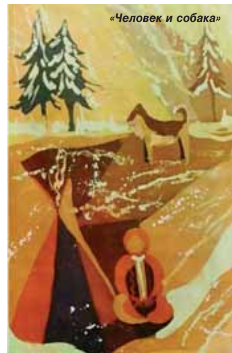
«Человек и собака»