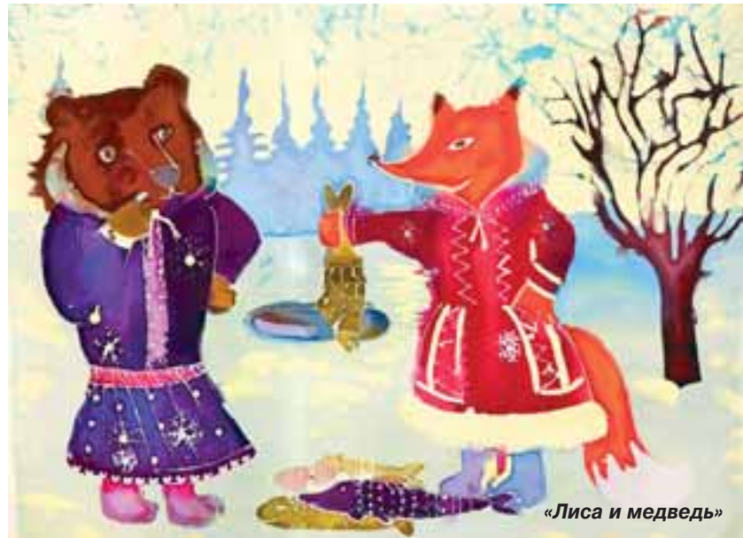
«Лиса и медведь»