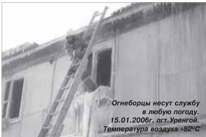
Огнеборцы несут службу в любую погоду. 15.01.2006г. пгт.Уренгой. Температура воздуха -52°С

ча предпринимать все меры по соблюдению пожарной безопасности на территории поселка. А также своевременно ликвидировать возгорания, спасать людей, их жилье и имущество от огня».