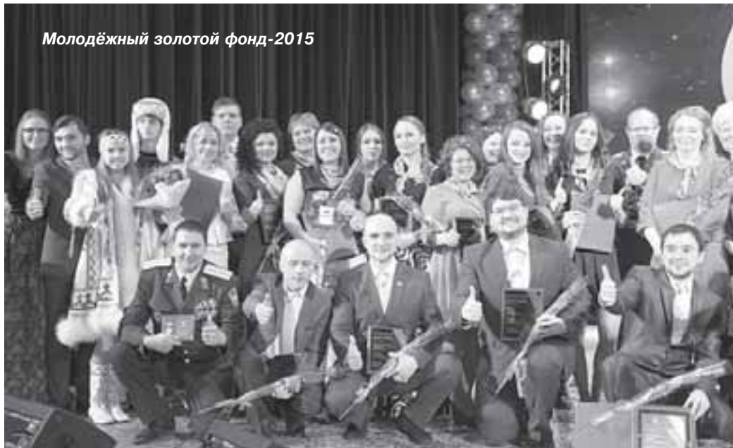
Молодёжный золотой фонд-2015