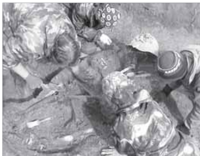
Так тщательно ребята проводят раскопки

Помимо применяемых методик в поисковой работе бывают случаи, что добровольцам помогает интуиция.