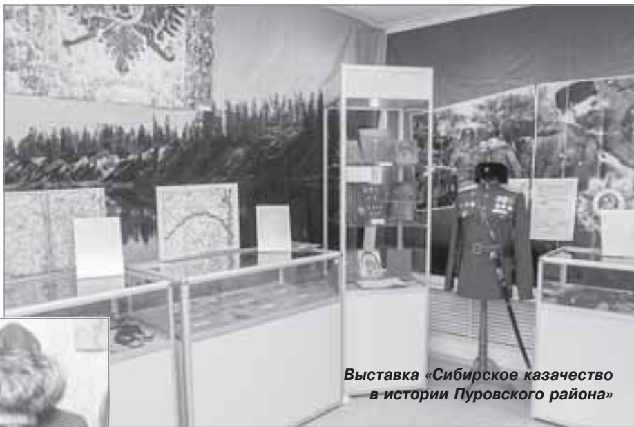
Выставка «Сибирское казачество в истории Пуровского района»

5. Выставка детских работ, выполненных в технике декупаж «Подарок для папы». 23-26 февраля, с 10.00 до 17.30. ДК «Газовик».