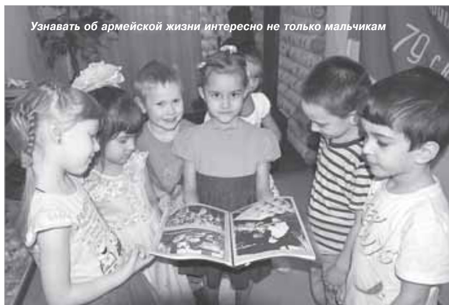
Узнавать об армейской жизни интересно не только мальчикам

взрослых. Моего папу будет поздравлять мама, она подарит ему подарок».