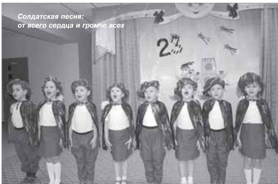
Солдатская песня: от всего сердца и громче всех