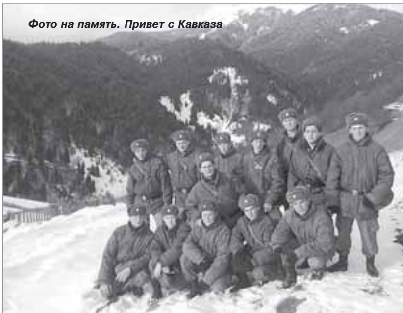
Фото на память. Привет с Кавказа

Что касается красот Кавказа, то они действительно впечатляют, особенно горы - в этом братья Кутлиахметовы убедились. Вот только омрачал красивый пейзаж вид ужасающих развалин на месте когда-то ухоженных дворики и улиц - недоброе наследство не объявленной войны. ■