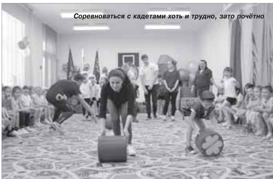
Соревноваться с кадетами хоть и трудно, зато почётно