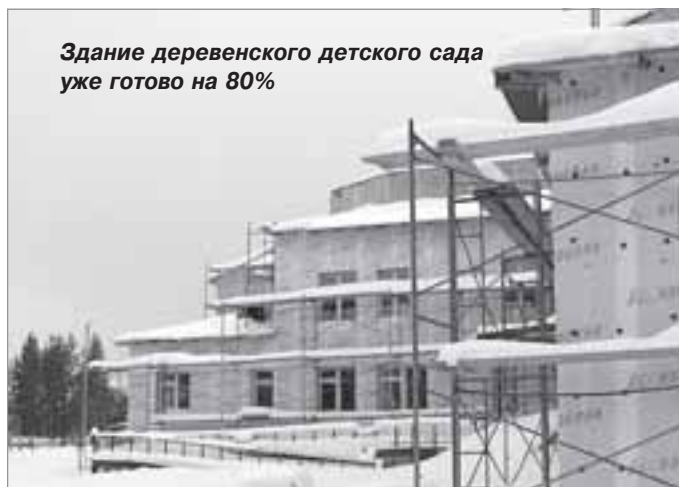
Здание деревенского детского сада уже готово на 80%