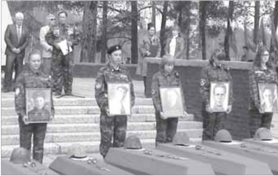
Торжественный митинг-прощание перед захоронением бойцов

2016 ГОД ОБЪЯВЛЕН НА ЯМАЛЕ ГОДОМ МОЛОДЕЖНЫХ ИНИЦИАТИВ. В ЕГО ПРЕДДВЕРИИ ЧЛЕНЫ МОЛОДЕЖНОГО СОВЕТА ПРИ ГЛАВЕ ПОСЕЛКА УРЕНГОЯ СОЗДАЛИ СВОЮ НЕКОММЕРЧЕСКУЮ ОРГАНИЗАЦИЮ «СОЮЗ МОЛОДЫХ, АКТИВНЫХ ЛИДЕРОВ» И РАЗРАБОТАЛИ ПРОЕКТ ВОЕННО-ПАТРИОТИЧЕСКОЙ НАПРАВЛЕННОСТИ «ДОЗОРНЫЕ ПАМЯТИ». ПО ИТОГАМ КОНКУРСА НА ПРЕДОСТАВЛЕНИЕ СУБСИДИЙ ИЗ ОКРУЖНОГО БЮДЖЕТА СОЦИАЛЬНО ОРИЕНТИРОВАННЫМ НЕКОММЕРЧЕСКИМ ОРГАНИЗАЦИЯМ В ЯНАО, ПРОШЕДШЕГО В 2015 ГОДУ, ПРОЕКТ ВОШЕЛ В ЧИСЛО ПОБЕДИТЕЛЕЙ.